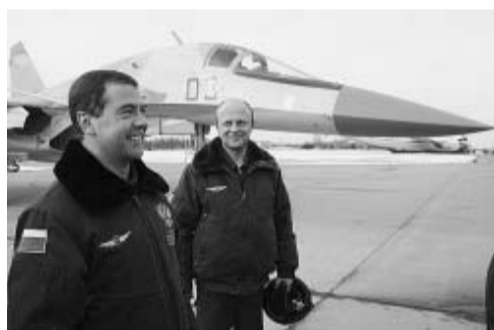
В ближайших номерах мы планируем рассказать о дальнейшей судьбе авиабазы в Кубинке.

«Когда садишься в такую машину, как 34-я, — конечно, уже гордость просто появляется. И другие машины прекрасные, конечно. Но всё-таки это уже новая машина. Сейчас на подходе пятое поколение. В это нужно вкладывать и деньги, и интеллектуальные ресурсы. Самое главное — не растерять тот потенциал, который был, вот это точно. Теперь я, как человек, который хотя бы полчаса в воздухе провел тоже, буду это понимать лучше, чем, скажем, до этого», — отметил Дмитрий Медведев во время беседы с лётным составом авиабазы.