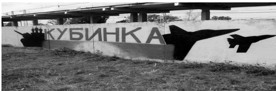
Коллаж о Кубинке, нарисованный молодёжью возле станции Кубинка-1

Как и обещали, публикуем фоторепортаж о самых благоустроенных и неблагоустроенных местах привокзальной площади.