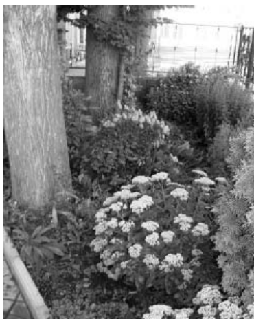
Цветник возле магазина детских товаров “Карапуз”