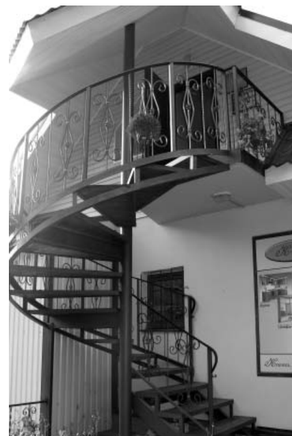
Благоустроенный фасад праздничного агентства “Ожерелье”