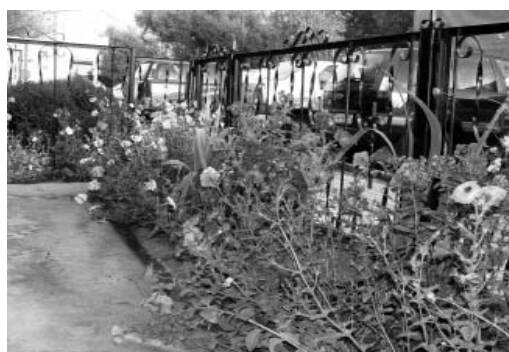
Цветник возле стоматологии в Кубинке - активного участника акции “Преображение”