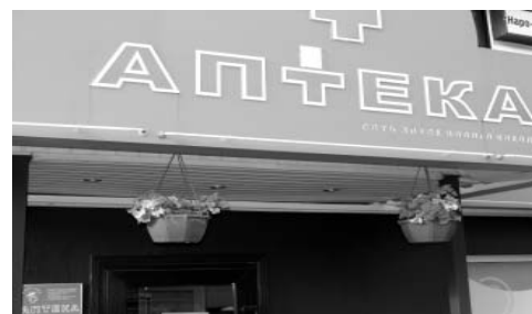
За внешним видом следят и в аптеке при въезде на площадь

Надеемся, что и в зимнее время у вас будет также красиво!