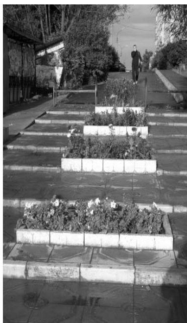
Территория возле магазина цветов “Дачник”. Здесь находится городской фонтан.