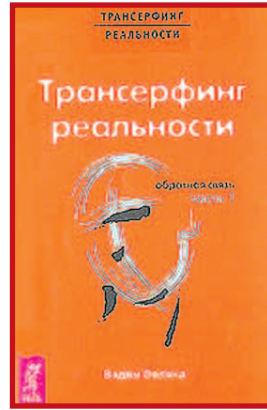
Вадим Зеланд – «Трансерфинг реальности» (2004)

Пугающее слово в названии книги оказывается не таким уж страшным на практике. Как выяснилось, трансерфинг – это не что иное, как мощная технология управления реальностью. Книга не относится к серии самоучителей по быстрому достижению успеха /богатства/ славы в жизни, где, в первую очередь, авторы призывают Вас изменить что-то в себе, чтобы достичь целей. Отныне Вам не придётся подстраиваться под окружающий мир, а наоборот, Вы научитесь подстраивать его под себя. Автор книги заранее предупреждает читателей быть готовыми к удивительным открытиям и приятным неожиданностям. Многие из тех, кто прочитал серию книг Вадима Зеланда, говорят, что его теории работают. Так это или нет? Проверьте сами.