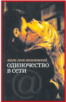
Януш Вишневский – «Одиночество в сети» (2006)

Книга, которая вызвала споры среди пользователей Интернета. Довольно стандартный сюжет о запоздалой любви учёно-генетика и замужней девушки с так и не разрешившейся драмой. Тема виртуального общения не только затронута, но и выпотрошена без остатка – от приведения текстов писем до сокровенных мыслей собеседников. Доверие и понимание, ожидание и риск, безумство и здравый смысл, страсть и любовь – как всё это может удержаться в устоявшихся жизнях двух людей? Сюжет настолько актуален, а язык доступен, что книга читается на одном дыхании, заставляя задуматься о простых человеческих ценностях. Что это – книжка на один вечер или удивительная история, застывающая в памяти на долгое время, – решать только Вам.