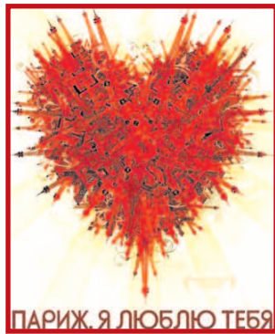
«Париж, я люблю тебя» (2006)

Альманах лучших режиссёров мира, перед которыми стояла задача всего за несколько минут раскрыть истории разных персонажей. Здесь есть счастье, отчаяние, тревога, радость, удивление, сомнение, страх, надежда и, конечно, любовь. И всё это происходит на фоне кварталов Парижа – la Ville de l'amour. Уникальность фильма заключается в том, что среди множества сюжетных линий каждый сможет найти что-то близкое именно ему. Фильм станет неисчерпаемым предметом исследования творчества разных режиссёров, созданных ими образов и судеб. А столица Франции, показанная на этот раз не с привычного ракурса Эйфелевой башни, вряд ли оставит равнодушными.