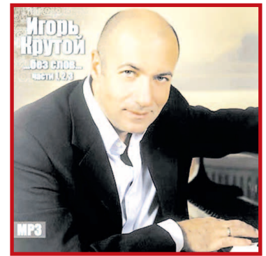
Игорь Крутой – «...без слов...» (2008)

На фоне популярных электронных битов кому-то альбом Игоря Крутого может показаться несовременным. Однако его музыка – из тех, что не имеют возраста и не принадлежат эпохе. Нажатия клавиш – отзвуки, пронизывающие насквозь. Музыка, которая живёт не просто сочетанием звуков, а своей искренней направленностью – от сердца к сердцу. Она настолько проста и гениальна одновременно, что подойдёт на все случаи жизни. Эта музыка поможет расслабиться после долгого дня или ненавязчивым фоном сопроводит любую работу. Станет отзвуками Вашей души в минуты упоения одиночеством и размышлений о судьбах Вселенной. И, безусловно, именно такая музыка прибавит романтики Вашим встречам и сделает их незабываемыми.