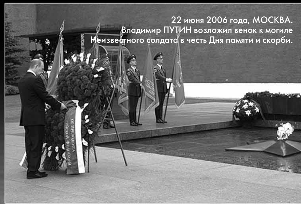
22 июня 2006 года, МОСКВА. Владимир ПУТИН возложил венок к могиле Неизвестного солдата в честь Дня памяти и скорби.

Поклониться памяти павших во время Великой Отечественной войны солдат и офицеров в Александровский сад также пришли главы городов и районов Подмосковья, ветераны войны, представители общественных организаций и объединений. Память погибших почтили минутой молчания. Торжественным маршем у Кремлевской стены, где никогда не гаснет Вечный огонь памяти, прошла рота Почетного караула и военного оркестра. Затем процессия во главе с Борисом Громовым проследовала к памятнику маршалу Советского Союза Георгию Константиновичу Жукову, где состоялась церемония возложения корзины с цветами и цветов к подножию памятника.