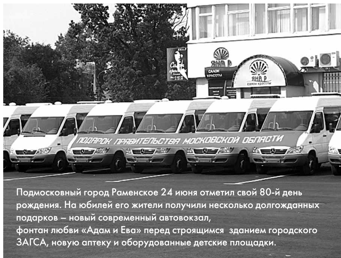
Подмосковный город Раменское 24 июня отметил свой 80-й день рождения. На юбилей его жители получили несколько долгожданных подарков – новый современный автовокзал, фонтан любви «Адам и Ева» перед строящимся зданием городского ЗАГСА, новую аптеку и оборудованные детские площадки.