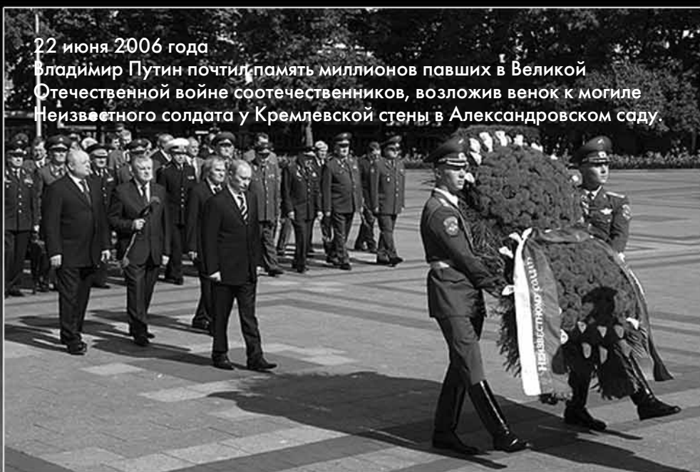
22 июня 2006 года Владимир Путин почтил память миллионов павших в Великой Отечественной войне соотечественников, возложив венок к могиле Неизвестного солдата у Кремлевской стены в Александровском саду.