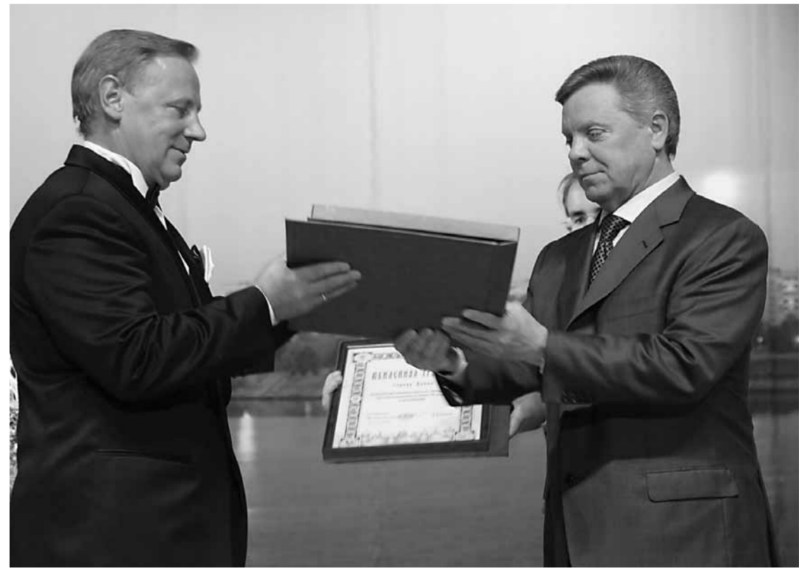
Вручение губернатором Московской области памятного знака и юбилейной грамоты мэру города Дубны.