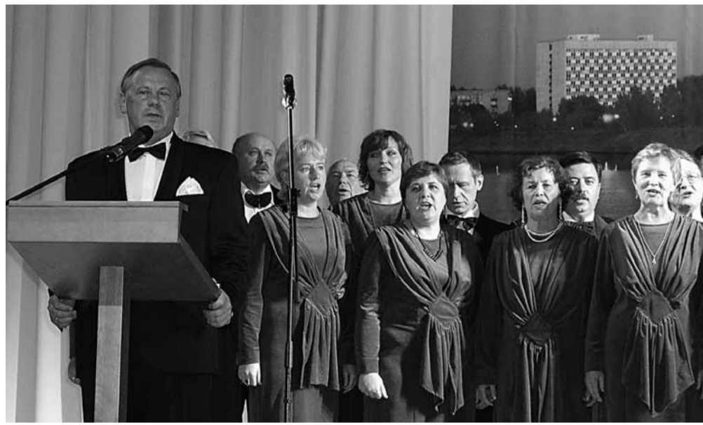
Выступление мэра Дубны Валерия ПРОХА на торжественном заседании, посвященном 50-летию города.