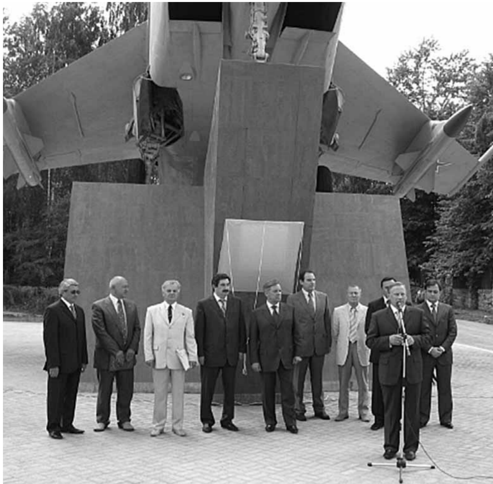
Открытие памятника легендарному истребителю МИГ-25.