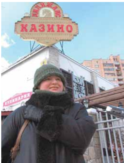
Светлана, бухгалтер: — Я думаю, что это связано с тем, что мы о Чубайсе просто немного подзабыли и нам хотят напомнить! Словом, «покушение» — это политическая реклама.