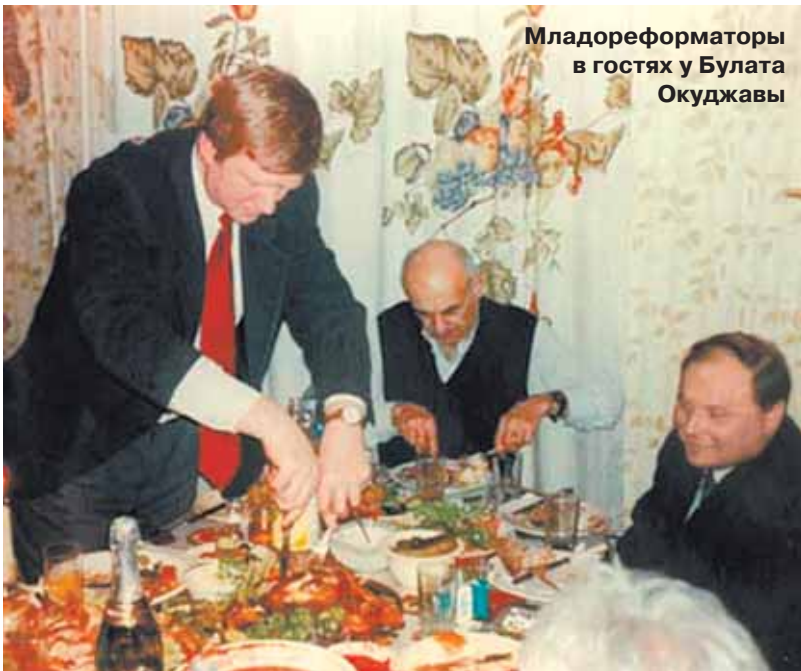
Младореформаторы в гостях у Булата Окуджавы