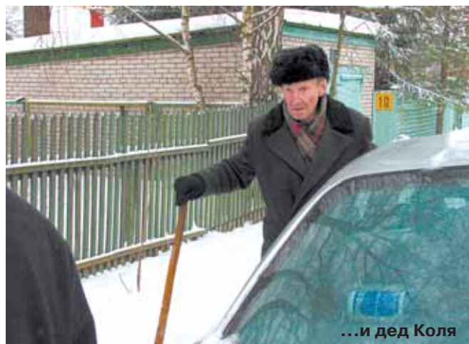
...и дед Коля

сович уже заявил, кажется, что имеет вполне конкретное представление о личности заказчика этого преступления. Да и мне кажется, что мотивы здесь гораздо серьезнее возможной личной неприязни семьи отставного военного.