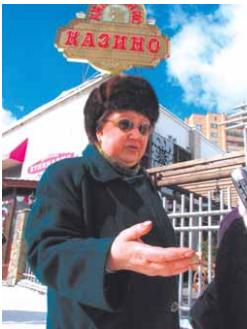
Любовь: — Хотя Чубайс и вор, но это не значит, что в него можно стрелять!