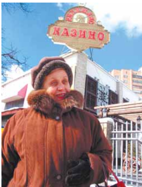
Галина Афанасьевна: — Во всяком случае, к потерпевшему мы все относимся не слишком тепло.

Опрос провели Николай Гошко и Елена Мороз