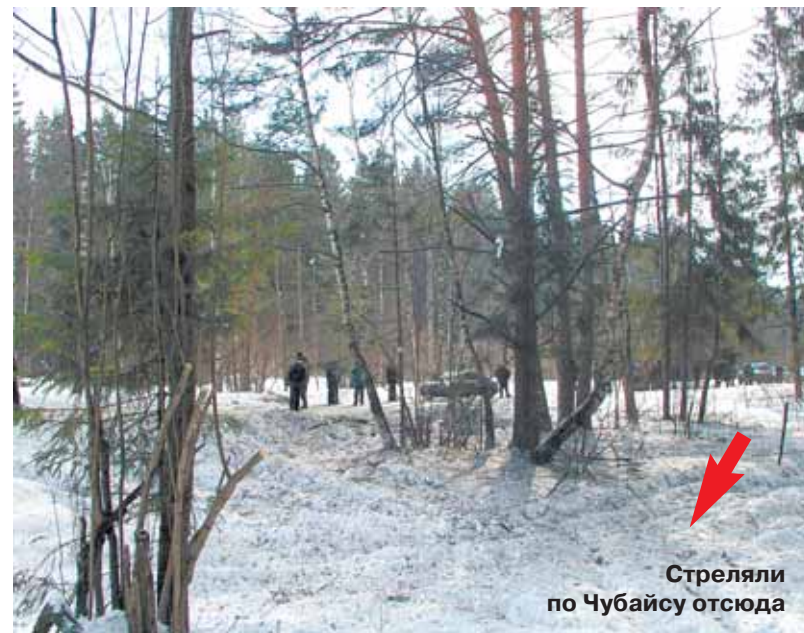
Стреляли по Чубайсу отсюда

вылетело заднее стекло и разбилось переднее. Сразу после взрыва «BMW» с Анатолием Чубайсом резко вывернул на встречную полосу дороги, которая в этот момент была пустой (утро, все ехали на работу в Москву, а обратное направление оказалось свободным), и, газанув, практически за секунды выехал из-под предполагаемого поля обстрела автоматчиков. Тут же из автомобиля «Мицубиси», который следовал за «BMW», выскочили вооруженные люди, телохранители Анатолия Чубайса, которые попали под хаотичный автоматный огонь. Стреляли, по предварительным данным, из двух автоматов (АКС или АКСУ — по разговорам оперативников). Было произведено три очереди. После чего нападавшие скрылись. В данный момент ведется розыск предполагаемых потенциальных киллеров Анатолия Чубайса. Сразу за прилеском начинается густой сосновый лес, к тому же заваленный снегом. «Непонятно, куда нападавшие могли направиться, потому что ближайшие 2 километра вглубь массива — это сухой и труднопроходимый лес», — выразил недоумение один из сотрудников центрального ФСБ, которое вместе с прокуратурой Одинцовского района и Московской области осматривало место покушения на Анатолия Чубайса.