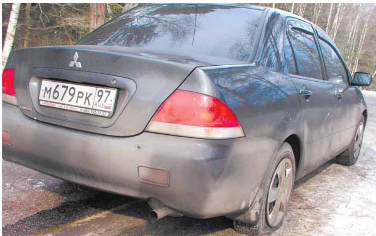
В «Мицубиси» охраны насчитали около десяти пулевых отверстий