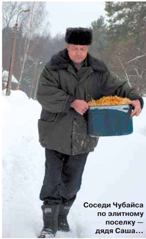
Соседи Чубайса по элитному поселку — дядя Саша...

А также объявляется льготный период на заключение договоров с рекламодателями. Заключив сейчас годовой договор с «ОДИНЦОВСКОЙ НЕДЕЛЕЙ», вы сможете разместить свою рекламу на 25% дешевле! Звоните по телефону 591-6317.