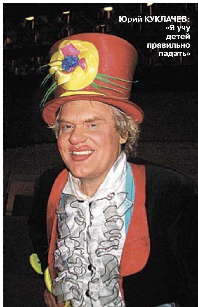
Юрий КУКЛАЧЕВ: «Я учу детей правильно падать»