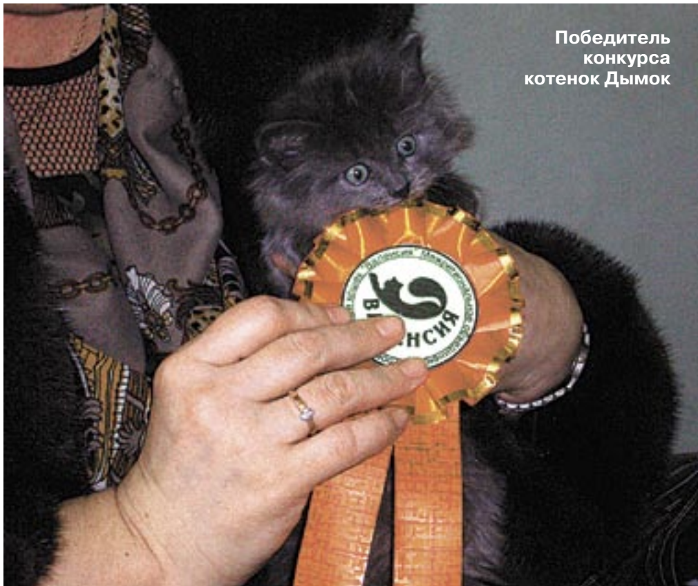
Победитель конкурса котенок Дымок