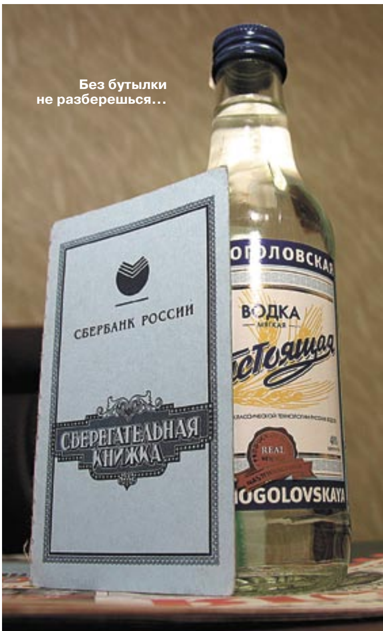
Без бутылки не разберешься...