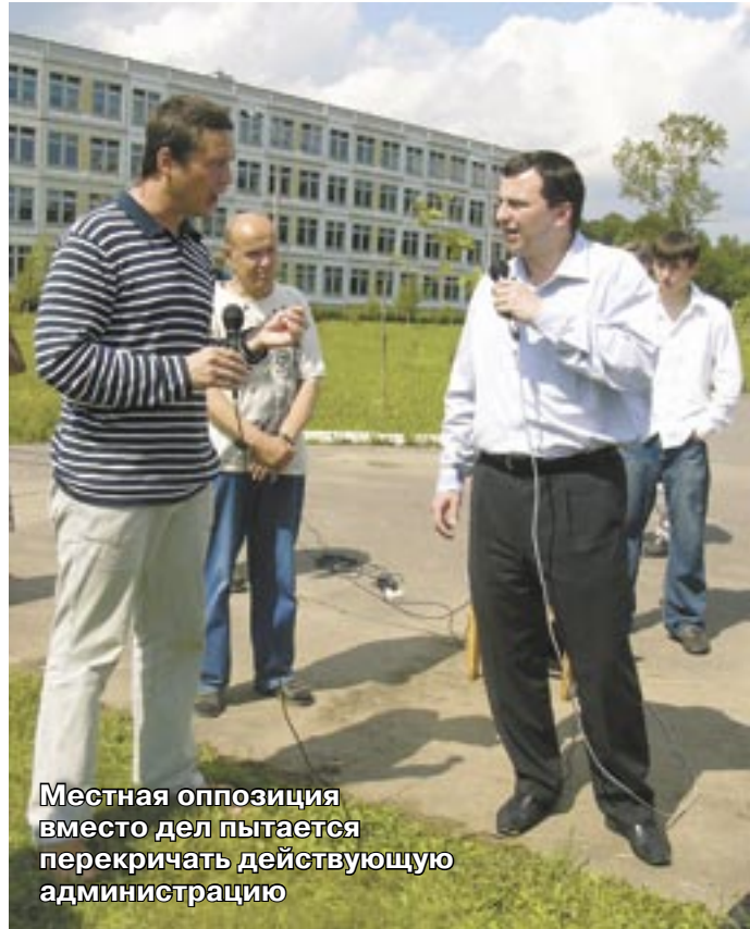
Местная оппозиция вместо дел пытается перекричать действующую администрацию