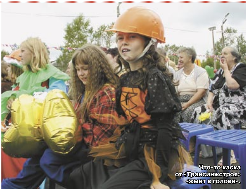
Что-то каска от «Трансинжстроя» «жмет в голове».