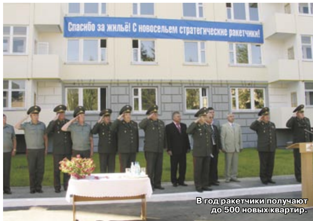
В год ракетчики получают до 500 новых квартир.

Ну, а далее следует бытовое продолжение истории - обустройство на новом месте и забота новоселов о приумножении семейных благ.