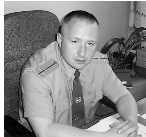
Ст. инспектор группы дознания 2 БСП ДПС УГИБДД ГУВД г. Москва