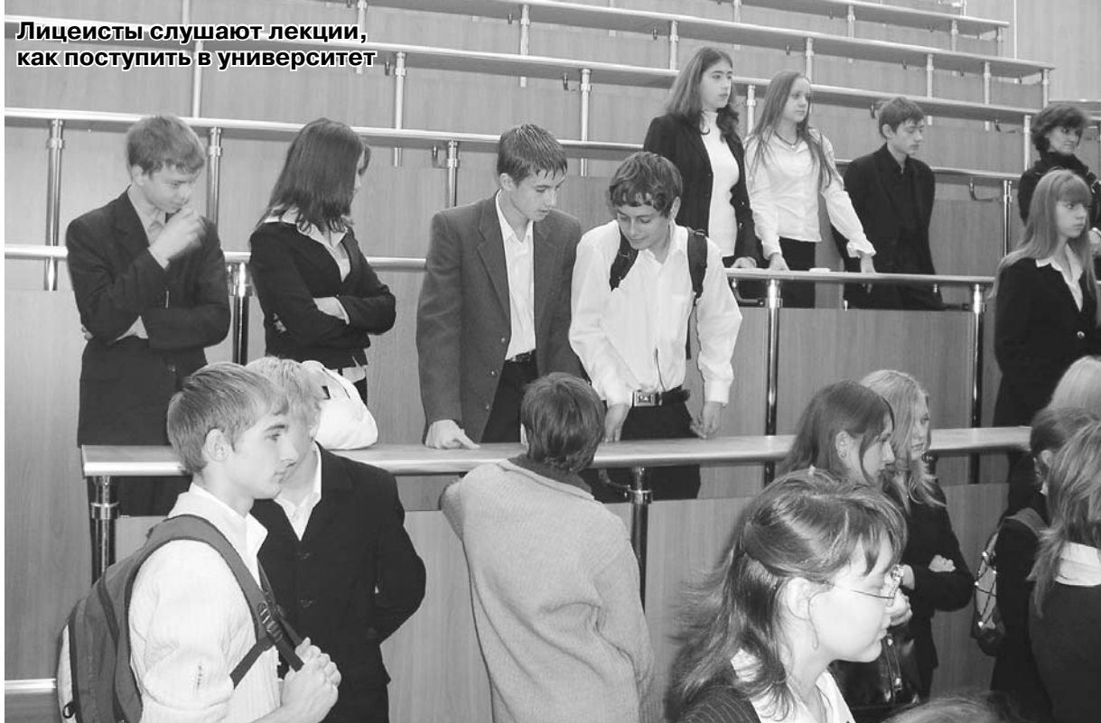
Лицейские слушают лекции, как поступить в университет