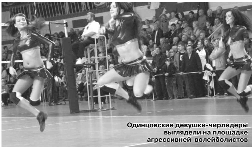
Одинцовские девушки-чирлидеры выглядели на площадке агрессивней волейболистов

«Динамо» же, напротив, почувствовало уверенность в собственных силах, поймало какой-то сверхъестественный кураж и провело остаток игры на одном дыхании. Решающей стала вторая партия, когда в концовке «Искре» удалось сократить отставание до четырех очков и показалось, что в матче вот-вот наступит перелом. Но московские волейболисты собрались не дали «Искре» воспрянуть духом. Тренер одинцовцев Сергей Цветнов активно пытался повлиять на ход игры с помощью тайм-аутов, которые ему приходилось брать чаще обычного, и которые проходили очень эмоционально. Однако эти меры должного эффекта не возымели.