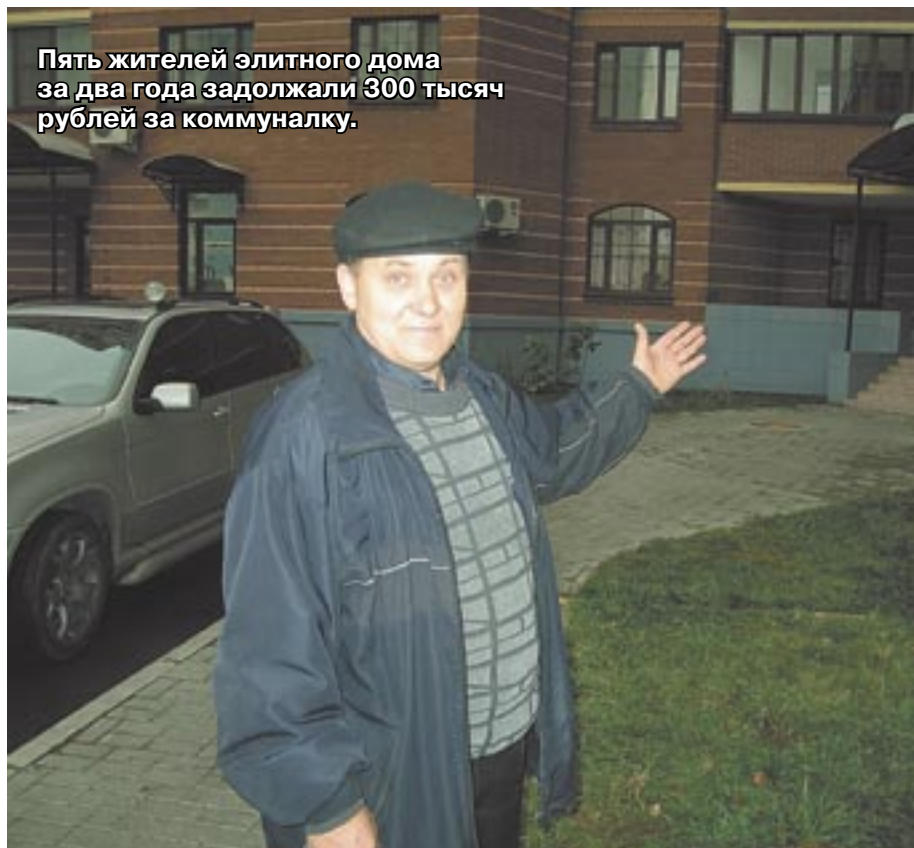
Пять жителей элитного дома за два года задолжали 300 тысяч рублей за коммуналку.

Злостными неплательщиками и вынужденными оппонентами домоуправа ТСЖ «Дворец» (Неделина, 15) стали члены семей сотрудников различных судебных инстанций, в том числе бывшего судьи Верховного суда, проживающих в данном элитном доме. Вынато аргументировать причину своей двухлетней (!) неоплаты коммунальных услуг профессиональные юристы отказались.