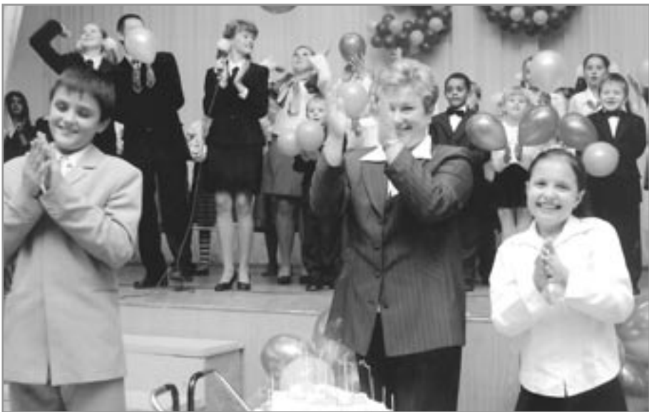
Одинцовская общеобразовательная школа № 5 отметила свой 30-летний юбилей, который пробудил лучшие чувства не только учащихся, но и всех участников торжества.

Новейшая история школы началась в 1975 году с переездом в нынешнее здание. А вообще история школы началась в середине XIX века, когда владевшая землями у Гребневского храма барыня подарила школе серебряный колокольчик, отлитый мастерами Вятки. И с тех пор ведется одна из школьных традиций - под малиновый перезвон начинать и заканчивать учебный год. Школа за это время несколько раз меняла свой адрес. В 1936 году на месте деревянного здания была построена уже кирпичная школа, в которой во время войны работал госпиталь. О значении же истории сказано следующее: «Тот, кто забывает прошлое, не имеет право на будущее». В школе помнят и гордятся всеми директорами, которые руководили ею за годы существования, а уже 8