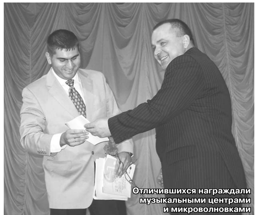
Отличившихся награждали музыкальными центрами и микроволновками