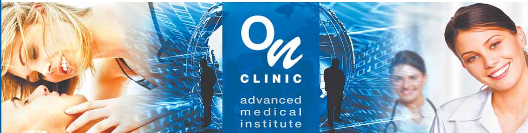
Получите консультацию специалиста по оказываемым услугам и возможным противопоказаниям.