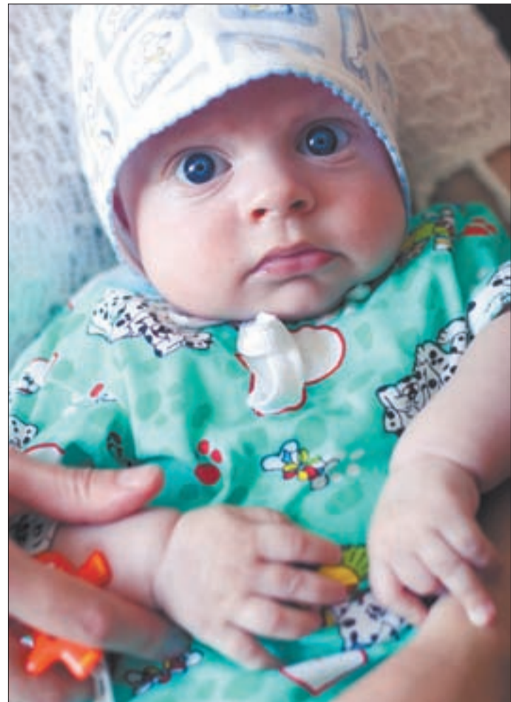
• Алёшке четыре месяца.

— Что там на улице-то делается? Солнце или метель?