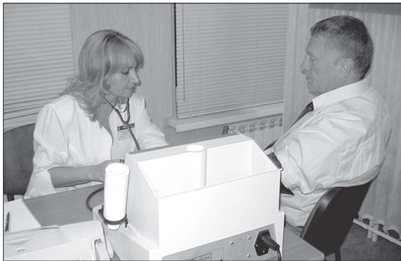
• Владимиру Жириновскому определяют биологический возраст.