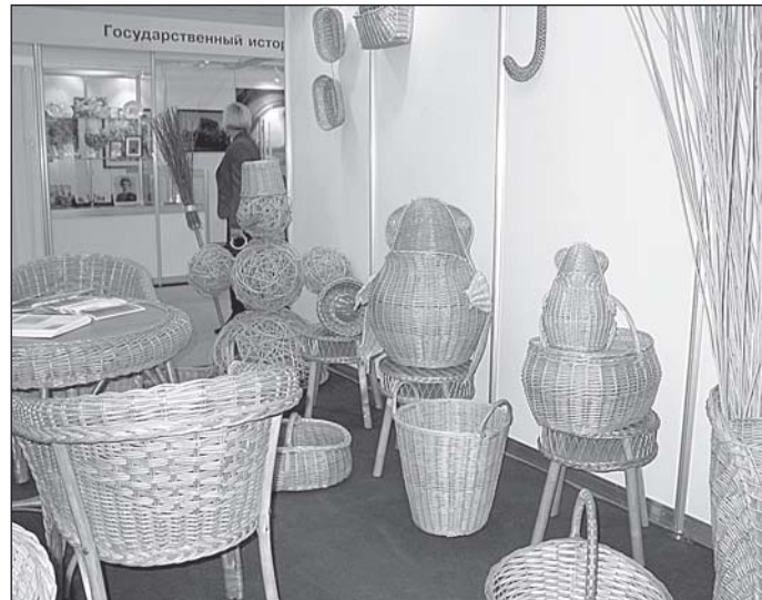
• Золотая соломка нашего Кобякова.