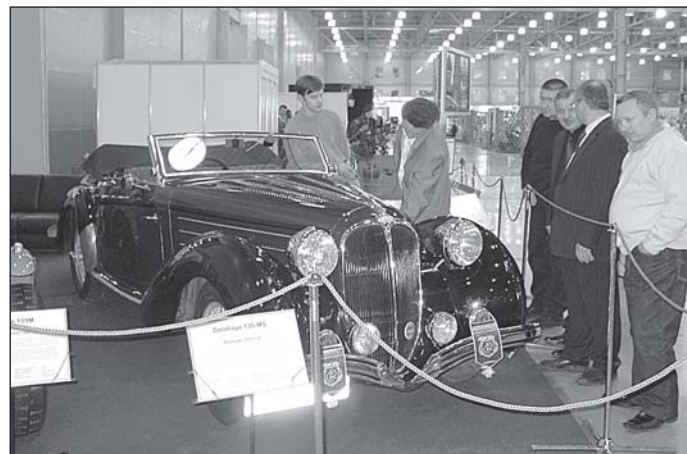
• Мимо раритетных автомобилей ни один мужчина пройти не сможет.