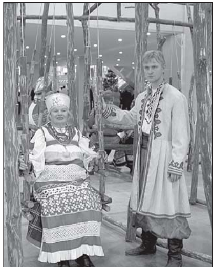
• Участники одного из фольклорных коллективов на открытии выставки.

Тепло приветствовали участников и гостей выставки полномочный представитель Президента РФ в Центральном федеральном округе Г.С. Полтавченко, министр культуры РФ А.С. Соколов, председа-