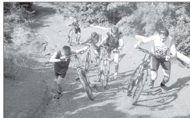
• А в Крыму в июле вместо лыж лучше на велосипедах...