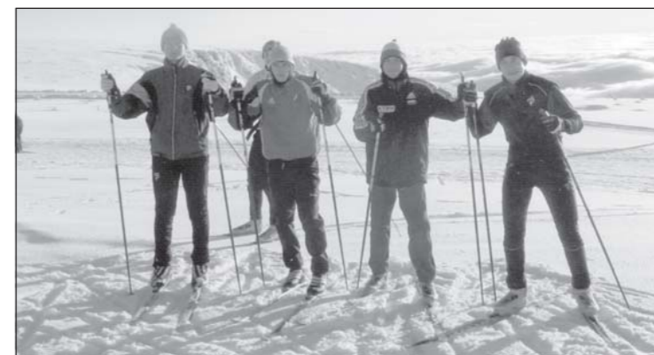
• Снежное безмолвие в Кировске нарушали лыжники из Одинцова. А высота солидная... 1200 метров над уровнем моря.