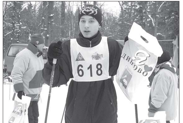
• ... И индивидуальный финиш