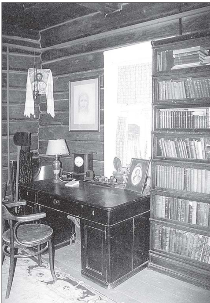
• Дом Танеева в Дютькове сохранил дух времени композитора, а молодые и уже известные музыканты наполняют этот дом танеевской музыкой.

дав в музее атмосферу начала прошлого века. К слову сказать, пока что это единственный профессиональный музей композитора С.И. Танеева в России. Возродились и прерванные традиции народного музея: сейчас здесь снова звучит музыка, регулярно проходят фестивали классической музыки, концерты музыкантов-исполнителей. Учрежден приз мемориального музея С.И. Танеева, который вручается лауреатам Международного конкурса камерных