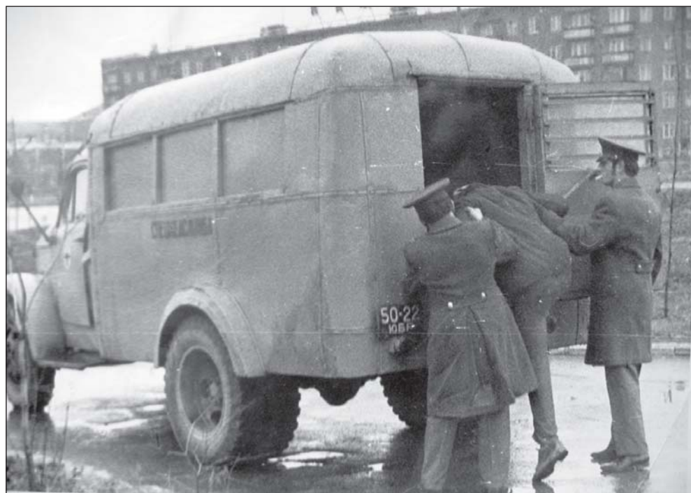
• 1978 год. Пьяного прохожего «загружают» в машину вытрезвителя в районе платформы Отрадное.