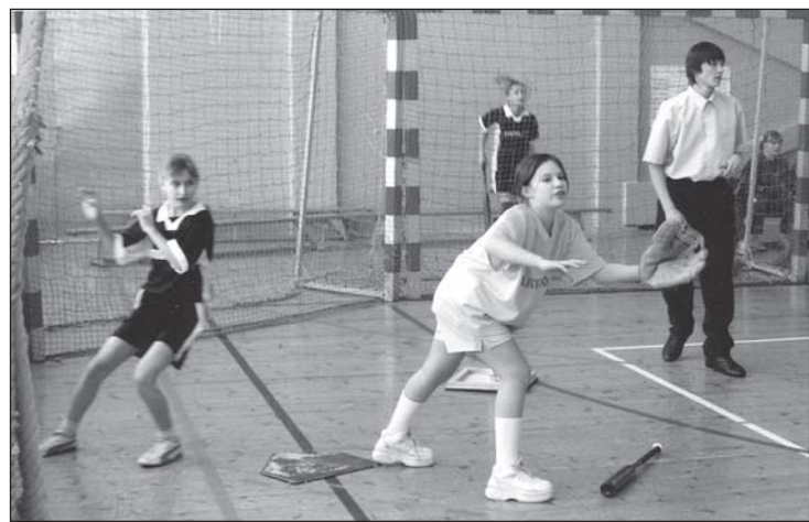
• Один из игровых моментов.