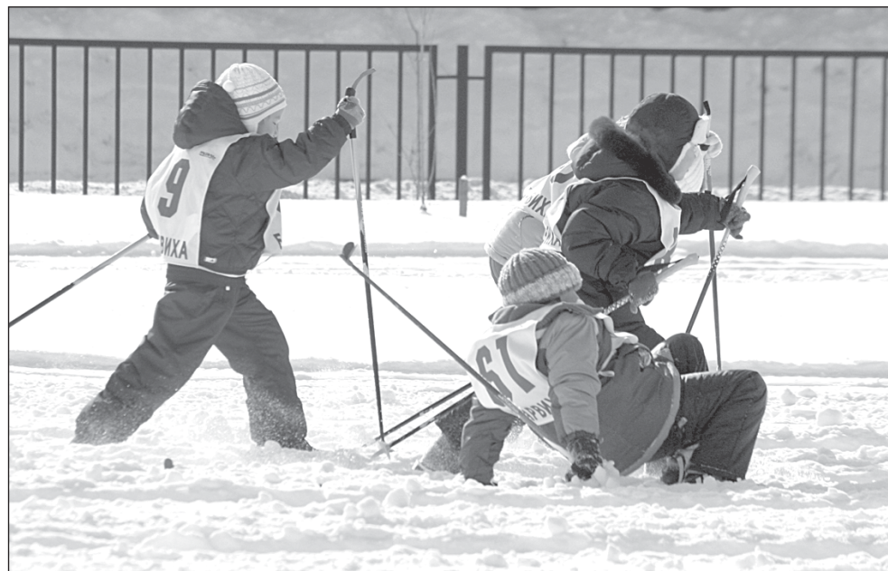
• Самые юные на лыжне.