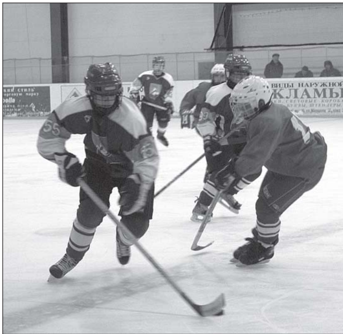
• В атаке одинцовские хоккеисты 1993 года рождения.

чтобы наши хоккейные дружины выигрывали как можно чаще и на солидных турнирах, то им надо создавать соответствующие условия. Как минимум на порядок лучше, чем в именитых ЦСКА, «Спартаке» и «Динамо». А талантливы наши ребята бесспорно.