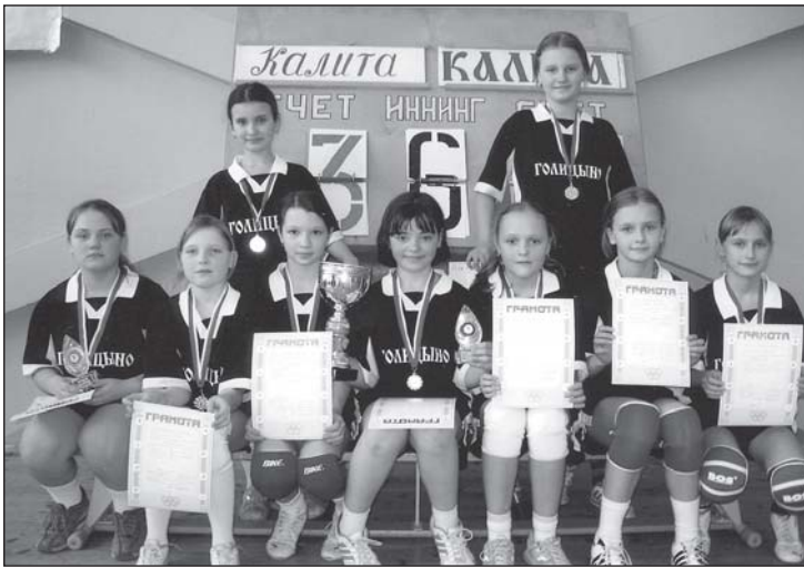
• Победители турнира.

В финальной игре встретились девушки Голицыно-1 и Кубинки. На предварительном этапе хозяйки соревнований не проиграли ни одной игры, в том числе и соперницам по финалу. Но на то он и Кубок, голицынская команда сумела лучше настроиться на эту игру и завоевала главный приз, оставив хозяйку лишь вторыми. За третье место поспорили команды Аку-