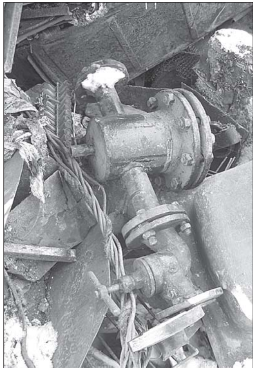
• Эту задвижку (даже покраска заводская облупилась не успела), возможно, кто-то безуспешно ищет.

Не в первый раз мы отправляемся проверять пункты, ведущие прием черных и цветных металлов. В таких рейдах наша газета уже участвовала, и по итогам проверок на страницах «Новых рубежей» появлялись статьи. Правда, в последний раз проблема поднималась довольно давно — в 2002 году. Ну что ж, есть возможность сравнить — какова динамика, что изменилось.