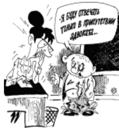
Рис. В. КРЕМЛЁВА.

Ночью температура воздуха плюс 3 градуса, днем плюс 8. Ветер юго-западный, два метра в секунду. Атмосферное давление 736 мм рт. ст.