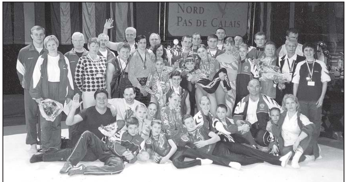
Сборная России по акробатике.

Присутствие гражданина, оформляющего на себя социальную карту, ОБЯЗАТЕЛЬНО, так как на карте должна присутствовать личная подпись гражданина и его фотография!