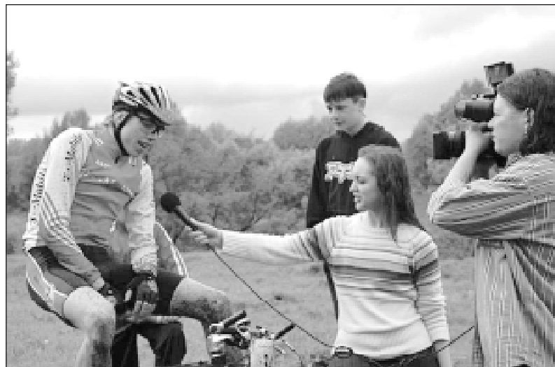
• Интервью ОТВ.

Все мероприятие оставило достаточно приятные и теплые впечатления и состоялось благодаря его организации и подготовке Интернет-порталом EXTREEM.ru (ЭкСтРиМ.ру), при участии одицовского пейнтбольного клуба «АТЦ-Альфа», а также при тесном содействии со стороны комитета по делам молодежи, культуре и спорту администрации Одицовского района, студентов Одицовского гуманитарного университета и музыкальной поддержке промо-группы Ju.BASS. Главный приз соревнований (велосипед) был предоставлен компанией «Веломоторс».