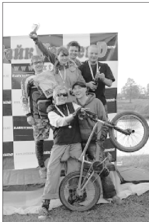
• Пьедестал оккупировала одицовская команда.

В субботу 27 мая, близ города Кубинка, состоялся первый в Москве и Московской области велосипедный фестиваль под названием «БайкWeekend №1», который планируется проводить ежегодно. Мероприятие, несмотря на его насыщенную программу, заняло всего один день. В программе были проведены заезды в велосипедных дисциплинах Кросс Кантри (гонки на велосипедах по пересеченной местности) и Даун Хилл (скоростной спуск на велосипедах с горы), а также соревнования по пейнтболу, в которых смогли принять участие желающие из числа зрителей, участников заездов и организаторов. Праздник начался в десять часов утра и закончился лишь в восемь вечера.