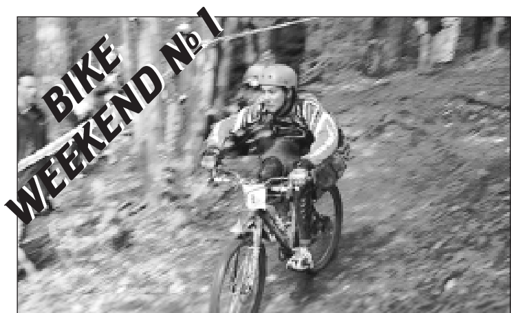
• Весь этот даунхилл!