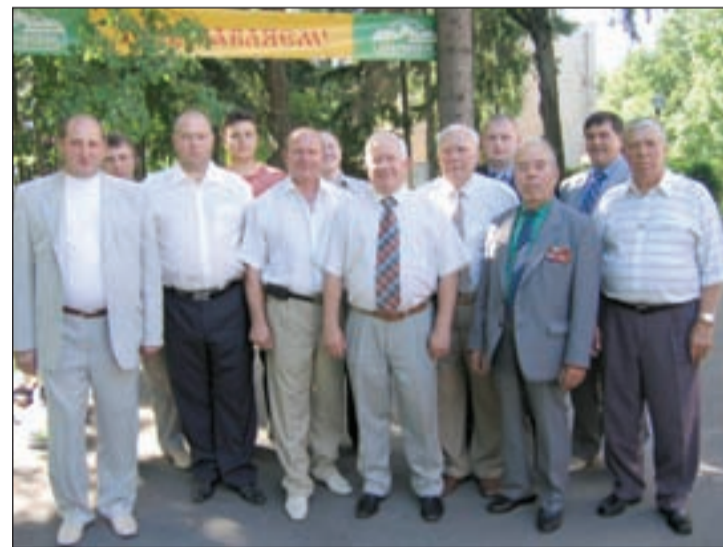
• Сотрудники ГАИ-ГИБДД и представители Центра ветеранов силовых и правоохранительных ведомств — в гостеприимном «Покровском».

— Многие считают, что наша служба легкая — ничего, кроме палки не поднимаем. А вы