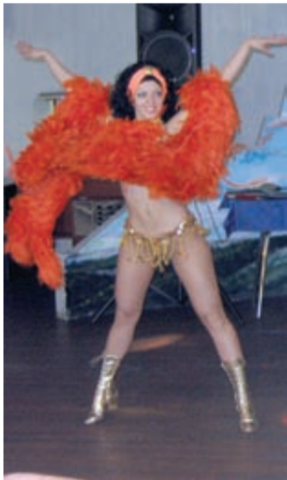
• И вот такие «горячие» подарки дарили в эти дни гаишникам.

В начале прошлой недели принимали поздравления в связи с 70-летием создания их службы сотрудники ГАИ-ГИБДД