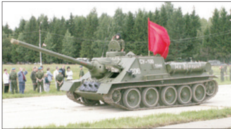
• Легендарная самоходная установка СУ-100.

В ближайшие полвека танки останутся основным видом оружия во всех наземных сражениях. Эту мысль высказал один из военачальников последнего периода советской истории. И сегодня она нашла подтверждение.