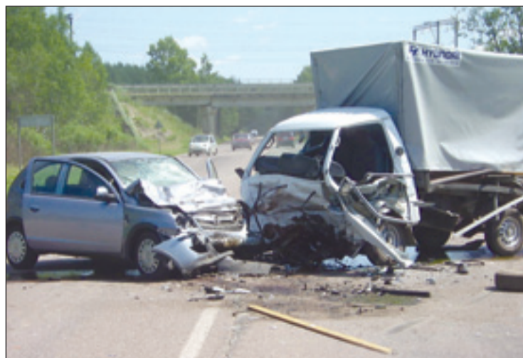
• Трагедия на 66-м километре Можайского шоссе.

24 июля в 19 часов 20 минут на 63-м километре Минского шоссе 29-летний житель Украины, управляя грузовой автомашиной «ДАФ» с полуприцепом, двигаясь в сторону области и совершая разворот в неустановленном месте, не вписался в поворот и совершил наезд на основную эстакаду. Следом в грузовик врезался «Крайслер» под управлением 43-летнего жителя Москвы. В результате столкновения обе машины загорелись. В итоге пострадал водитель «Крайслера». С различными травмами и ожогами мужчина был доставлен в Никольскую больницу.