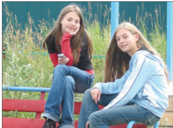
• Хоть на вид мы вполне городские...