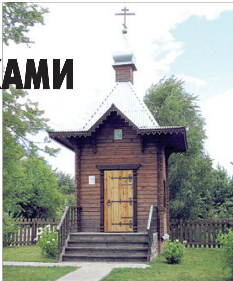
• Часовенка в центре Солослова

Продолжается рост Солослово и после октября 1917 года. В 1933 году здесь выдавала продукцию фабрика искусственного меха, работал колхоз «Расцвет коллективного труда». В 136-ти дворах проживало более 700 человек.