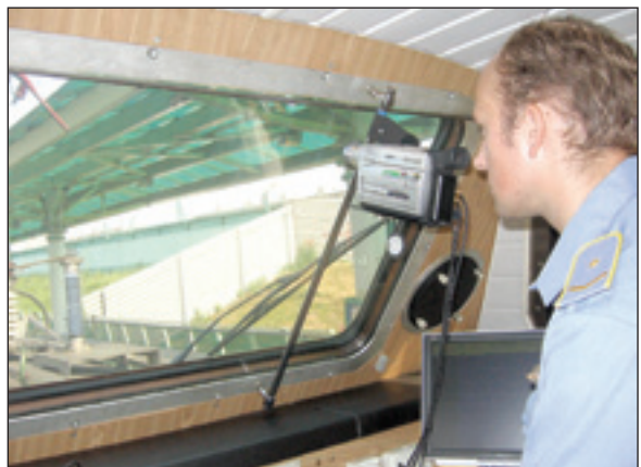
• В «капитанской» рубке.

ЭТО — передвижная электротехническая лаборатория, своеобразный отдел технического контроля по железнодорожному ведомству. Появляется на каждом из многочисленных направлений Московской железной дороги с периодичностью примерно раз в месяц. Вагон, который тянет собственный локомотив, начинён электроникой, что называется, под самую крышу. Впрочем, и на крыше — тоже электроника. Она ошупывает, осматривает, просвечивает и... уж не знаю, в общем, чуть ли не обнюхивает контактную сеть, без которой движение по нынешним железным дорогам (по крайней мере — в Подмосковье точно) просто невозможно. Внутри вагона стоит мощный сервер, на жесткий диск которого и стекаются все параметры, снятые многочисленными датчиками и измерителями. Появилась такая техника в распоряжении железнодорожных инженеров всего пару лет назад. Прежние измерительные лаборатории были главным образом механическими — самописцы вели учёт измерений на бумажные ленты. Морока. А сейчас компьютерная программа способна работать сама, сразу же обращая внимание оператора на проблемные участки. Ну, пригляд человека, конечно, нужен — в частности, электроника не способна пока увидеть, к примеру, разбитый фарфоровый изолятор, требующий ремонта, или порвавшийся трос стяжки. Поэтому каждая поездка, пройденная электронным вагоном, пишется ещё и на три видеокamеры — они помогут локализовать такую неисправность с точностью до метра.