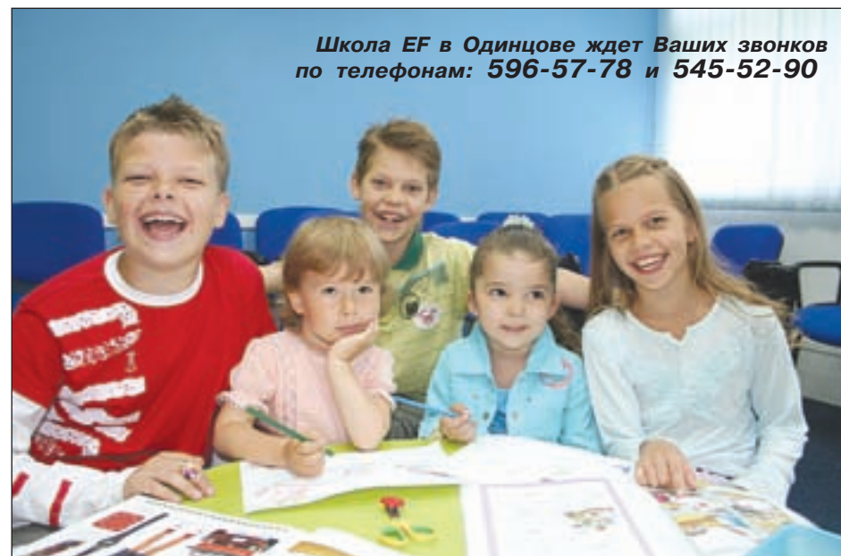
Школа EF в Одинцово ждет Ваших звонков по телефонам: 596-57-78 и 545-52-90

Вы владеете английским языком на высоком уровне и хотите развивать свои лингвистические способности? Вы хотите, чтобы ваши дети весело и интересно отдохнули во время каникул? Вы хотите приобрести новых друзей, познакомиться с интересными, а возможно полезными людьми? Приходите! Мы Вам всегда рады!