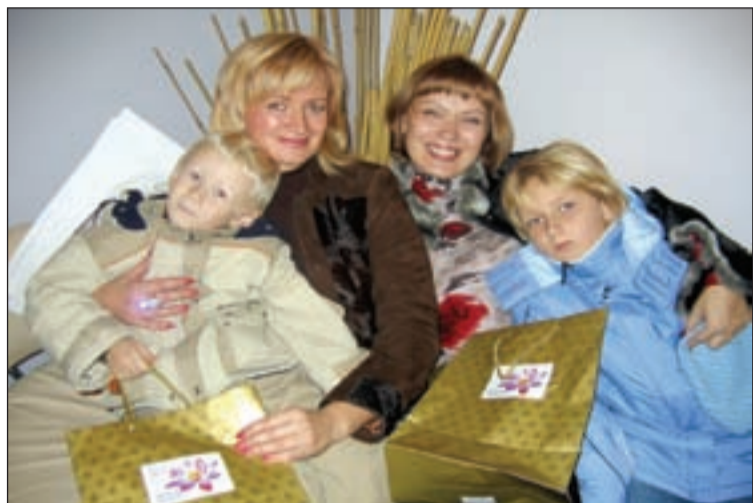
• С таким настроением и, конечно, с подарками уходили с праздника клиенты «Цветущего лотоса».