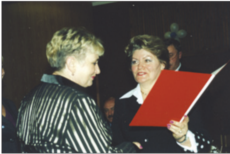
• Министр социальной защиты населения правительства Московской области Валентина Лагункина (справа) поблагодарила работников интерната за «особый склад характера».

ИНТЕРНАТ предназначен для проживания инвалидов, страдающих различными заболеваниями, и для нуждающихся в уходе, бытовом и медикаментозном обслуживании, социально-трудоустройстве, адаптации. Он расположен на территории в семь гектаров, в двух пятиэтажных жилых корпусах, соединенных переходом. В интернате есть баня, прачечная, гараж, тренажерный зал, мастерские для трудотерапии, домовая церковь. Есть и свое подсобное хозяйство: четыре теплицы и свинарник, так что проживающие в интернате (более 400 человек) всегда могут угоститься свежими овощами и мясом. Они полностью обеспечены всем необходимым и находятся под постоянным наблюдением врачей разных профилей. Обеспечен необходимый уход и для лежачих. Интернат располагает протезами, костылями, ортопедической обувью, слуховыми аппаратами, очками, инвалидными колясками. Проживающие в доме-интернате ежегодно проходят санаторно-курортное лечение в санаториях Подмосковья. Многие из них также ежегодно принимают участие в спартакиаде инвалидов Московской области, посещают концерты, спектакли, выставки в Москве и области. Все трудоспособные имеют индивидуаль-