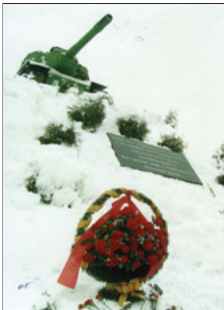
• На мемориальной доске выбито: «Здесь, на Скирмановских высотах, с 26 октября по 19 ноября 1941 года войсками 16-й Армии Западного фронта был разбит миф о непобедимости немецкой армии».