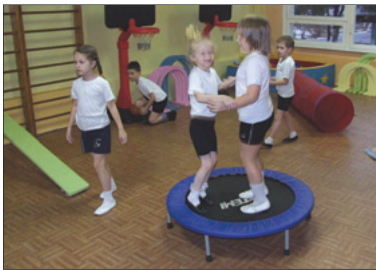
• «Мы верим твердо в героев спорта». Кадр сделан в детском саду «Солнышко» на Можайском шоссе. Впрочем, мог быть сделан и в любом другом детском саду округа Ларисы Лазутиной: помощь в приобретении оборудования для спортзалов была оказана всем нуждающимся.

Александр ЛЫЧАГИН.