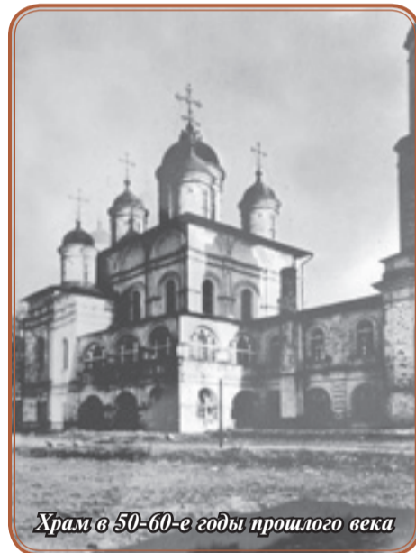
Храм в 50-60-е годы прошлого века

Хочется верить, что в перспективе храмовый комплекс приобретет вид, который он имел в течение XIX и первой половине