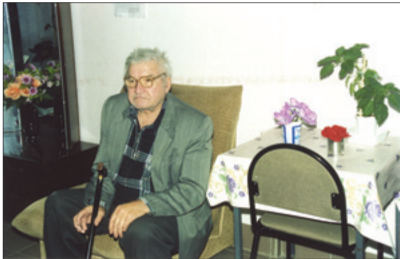
• Из жизни «проживающих».