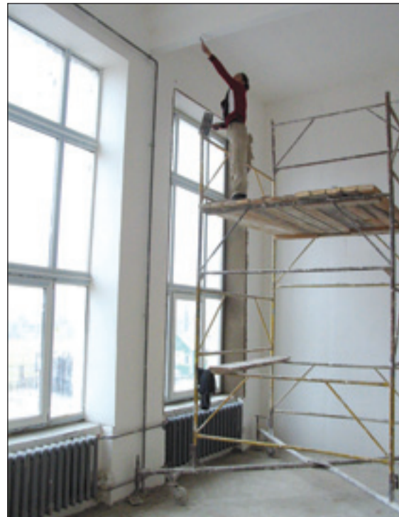
• В этом здании идут последние отделочные работы. Когда новое здание отдела войдет в строй, в него, пожалуй, будут водить экскурсии. Судите сами: майяра занят отделкой... спортзала для миллионов! Уже практически готовы дежурная часть, кабинеты следователей и участковых. А на третьем этаже разместится общежитие для сотрудников. Средства на такой ремонт нужны большие. Но доля депутатского участия есть и здесь: 600 тысяч были выделены по инициативе депутата Владимира Дука.

Как видим, проблем много, и они серьезные. Здесь, я думаю, помогут меры в русле выполнения национального проекта по сельскому хозяйству, который начал работать в Подмосковье. Свои плоды он даст.