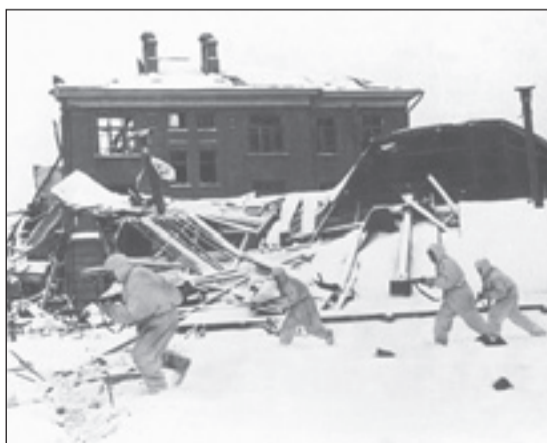
• Бойцы Советской армии, первыми вошедшие в подмосковный Наро-Фоминск.

Подготовили Антон КУЗНЕЦОВ и Николай МИТРОНОВ.