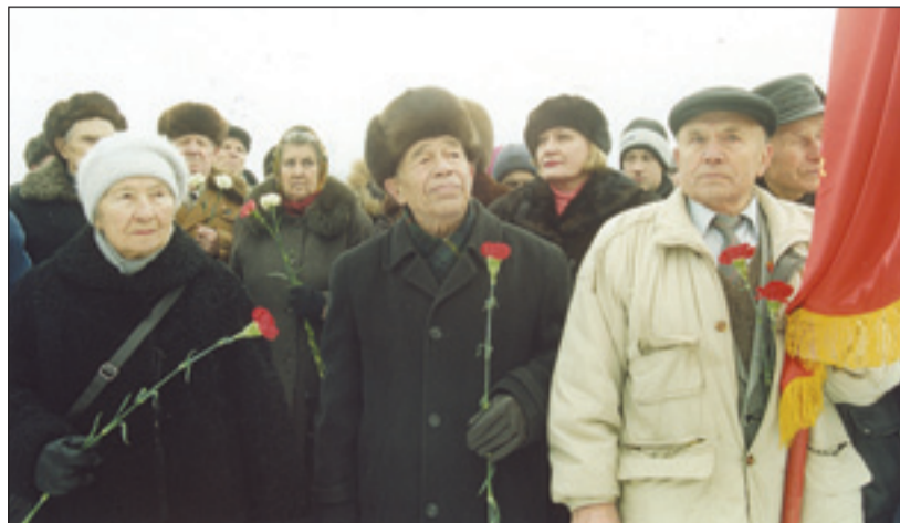
• Приехали вспомнить и поклониться.

В Рузском районе, у деревни Скирманово, прошел торжественный митинг, посвященный 65-летию битвы под Москвой и открытию реконструированного мемориала «Курган Памяти».