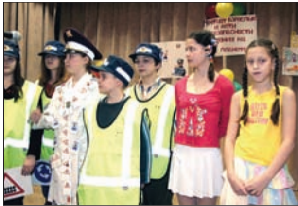
• Юные инспектора дорожного движения из школы имени А.С.Попова.

18 ноября в Одинцовском центре эстетического воспитания прошел районный смотр-конкурс по предупреждению детского дорожно-транспортного травматизма «Мечтают взрослые и дети о безопасности движения на всей планете». В нем приняли участие 23 команды из общеобразовательных школ Одинцовского района.