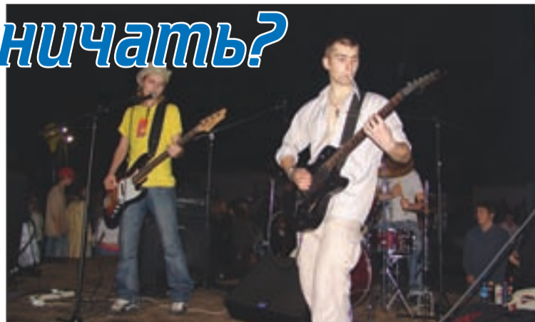
На снимке: на качество исполнения сигарета во рту не влияет никак. Без неё — плохо. И с ней — не лучше.

И это не только точка зрения организаторов — выступления группы последнее время совершенно не поднимают настроение зрителей, вызывают полный негатив и недовольство публики, ну за исключением, разве что, преданных поклонников в виде друзей-приятелей самих