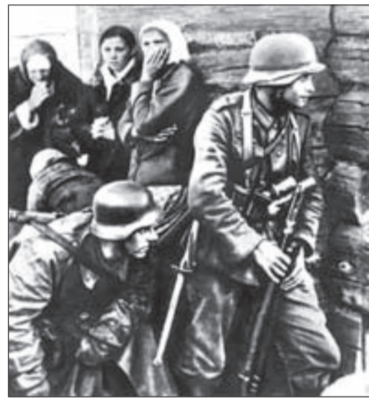
Фашисты в русской деревне.