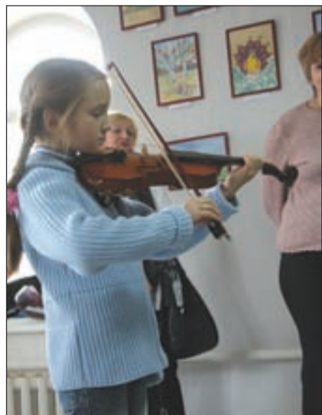
• Юные художники талантливы во всем и наглядно доказали это всем присутствующим.

Ирина КОМЕЛЬ.