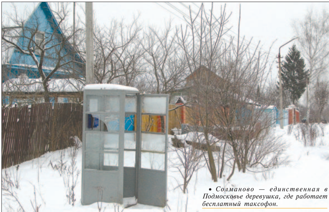
• Солманово – единственная в Подмоскowie деревушка, где работает бесплатный таксофон.