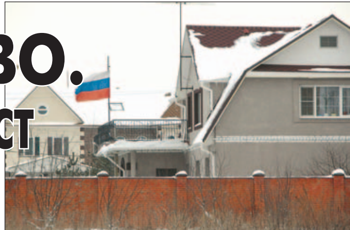
• Солманово «новое».