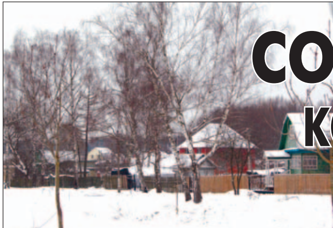
• Солманово «старое».