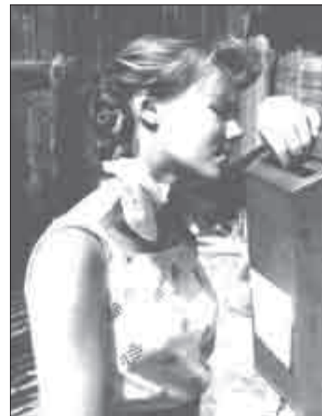
• «Не принесли ещё «районку»? Посмотрим...»