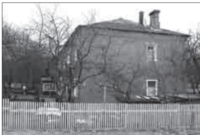
• Эти дома по Солнечной когда-то были желанной мечтой для работников второго завода.