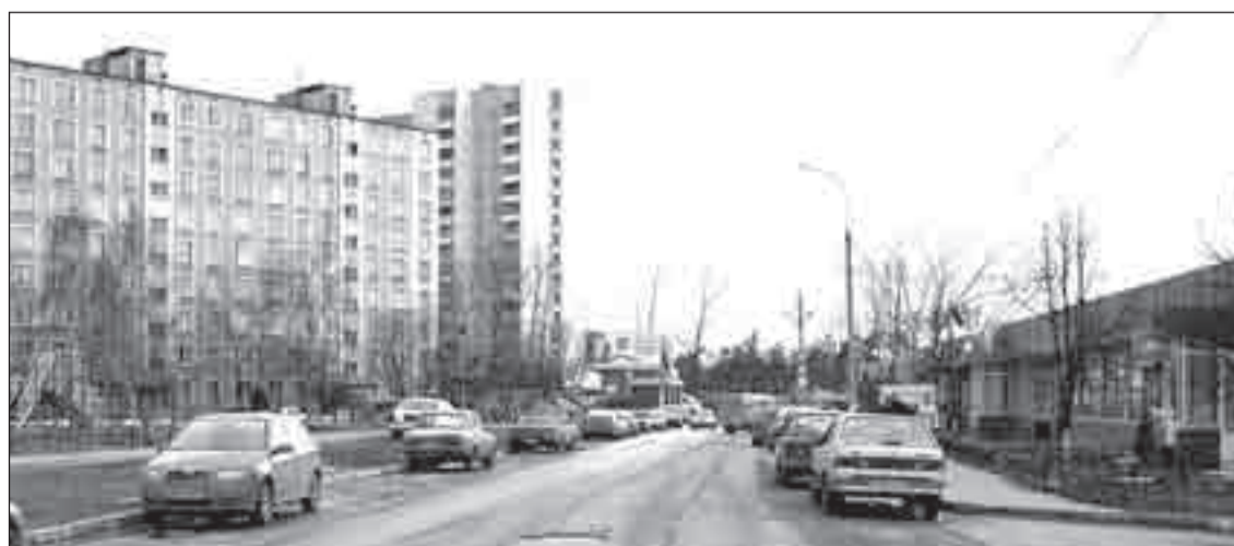
• Улица Союзная, ноябрь 1962 года. На том же самом месте – март 2007 года. Почувствуйте разницу!