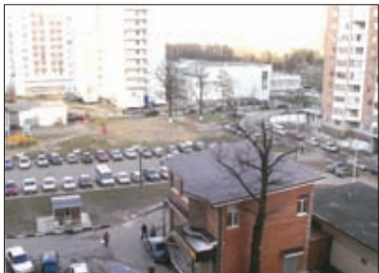
На снимках: 7 апреля — первый снимок сделан около 11 часов, второй — около 19. Николай МИТРОНОВ. Фото автора.

Одинцовское управление социальной защиты населения сообщает, что 13 апреля 2007 года в 12 часов средняя школа пос. Горки-10 приглашает на традиционную встречу бывших несовершеннолетних узников фашистских концлагерей.