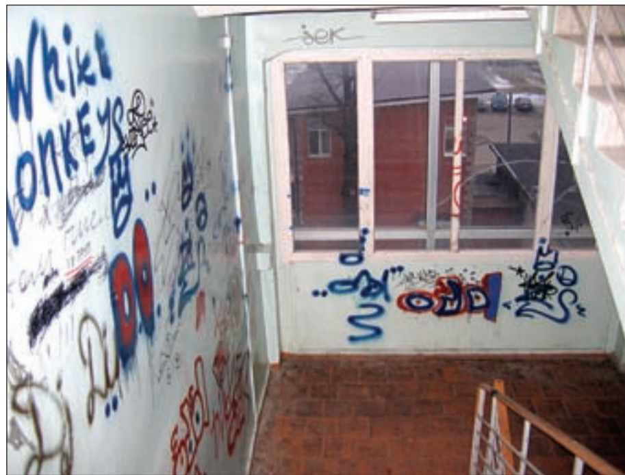
• Такой вид в подъезде никому не поднимет настроения.

— Сегодня государство постепенно уходит из сферы обслуживания жилого фонда, и рано или поздно эта ноша ляжет на плечи жителей. Мы поставили перед собой цель, на мой взгляд, более важную, чем просто благоустройство подъездов, — воспитать у населения чувство собственника, ответственно относящегося не только к своей квартире, но и к общедомовой территории. Для этого в 2002 году начали эксперимент — предложили жителям провести ремонты, в которых они примут непосредственное участие, и взять свои подъезды на общественную сохранность. Решение о таком шаге принимается на общем собрании, между эксплуатирующей организацией и жильцами заключается договор, в котором оговариваются все обязательства сторон. Затем жильцы знакомятся со сметой работ, собирают посильную плату на ремонт подъезда, а наше предприятие производит ремонт. Должен подчеркнуть, что суммы, собранные людьми, во много раз меньше тех, что действительно затрачены на ремонт. Сравните — например, в 2002 году жильцы всех отремонтированных подъездов собрали 37 тысяч рублей, а сметная стоимость объектов составила 483 тысячи 664 рубля. Наша цель не