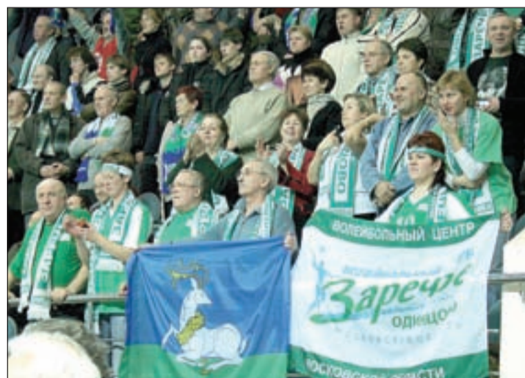
• Болельщики приветствовали свою команду-победительницу стоя. В этой победе есть и их немалая заслуга.

В женском финале Кубка России полуфинальные пары были более взвешенные, что и показали игры. Столичное «Динамо» встретилось с хабаровским «Самородком». В первой партии гости с Дальнего Востока выиграли – 25:20. Ключевой стала вторая партия, в которой «динамовки» уверенно вели порой до восьми очков, но чуть было не растеряли все. Все же выиграли – 21:25. Следующие две партии они уже контролировали ситуацию на площадке – 19:25 и 17:25.