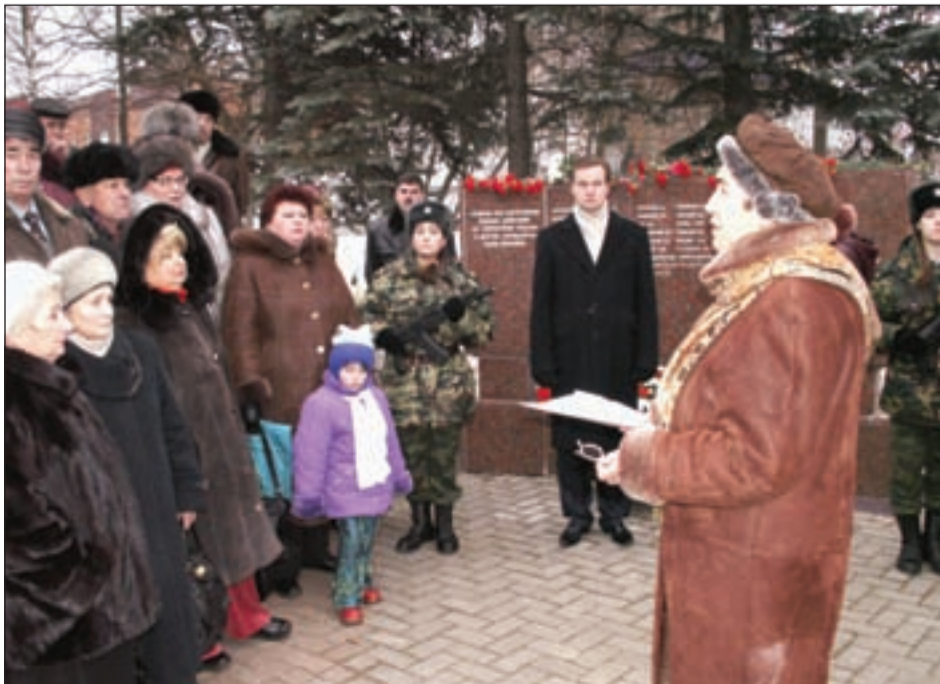
• Митинг у мемориала Славы в Одинцово.