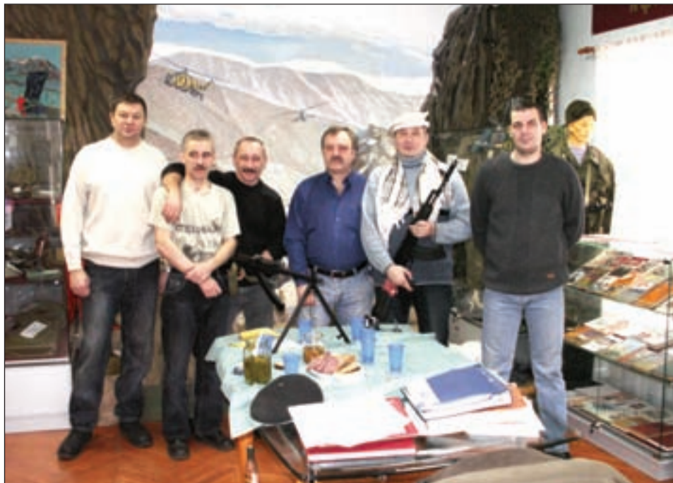
• Наши земляки, прошедшие Афганистан, в Одинцовском краеведческом музее.