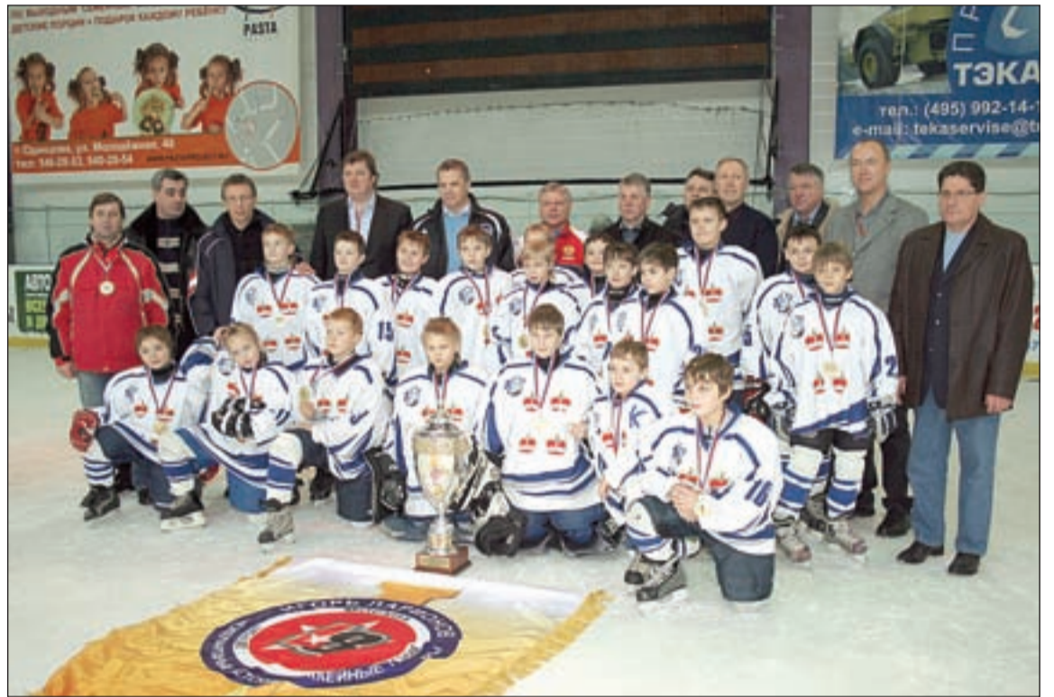
• Фото на память команды-победительницы со всеми почетными гостями турнира.

Финальная игра между «Дмитровом» и «Крыльями Советов» выдалась по-настоящему захватывающей. В первом периоде