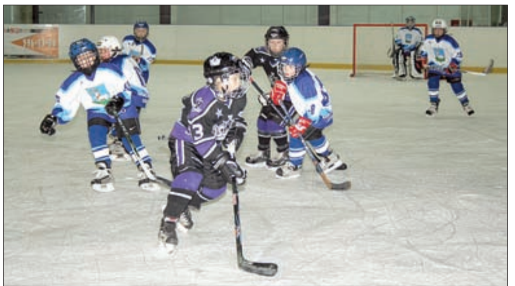
• Игровой момент встречи «Одинцово-98» против «Лос-Анджелес Кингс» (США). Юные американцы в очередной раз идут в атаку на наши ворота.