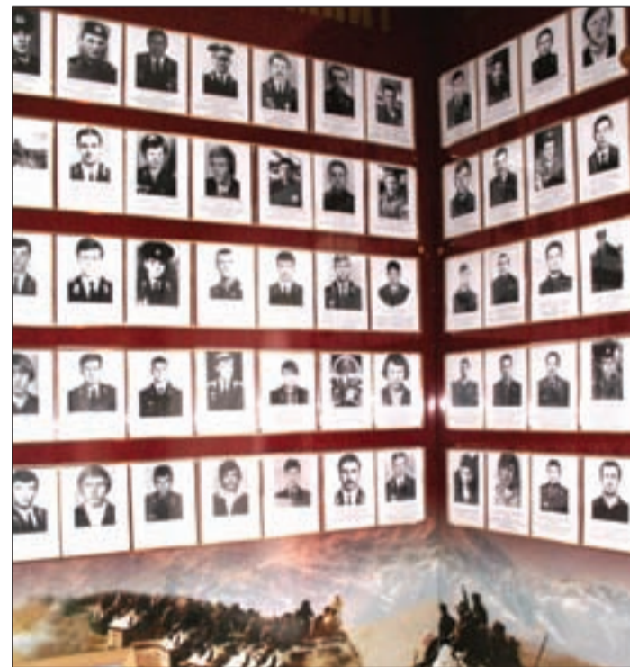
• Вечная память