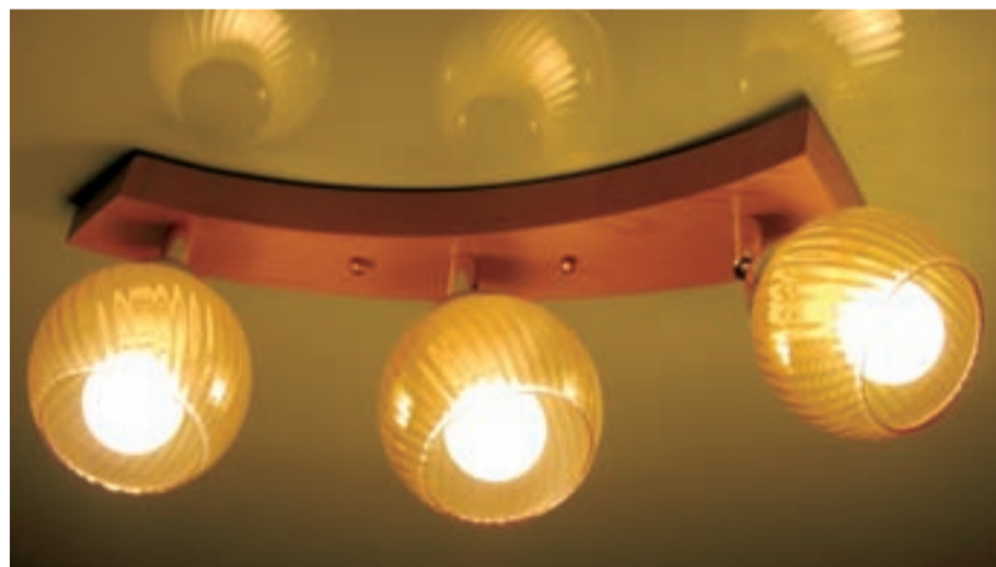
• Яркий свет в квартире становится всё более дорогим удовольствием.

— С 1 января 2008 года повысились цены на газ — на 25 процентов, на электроснабжение — на 14 процентов, обслуживание лифтового хозяйства — на 10 процентов, услуги покупной продукции «Мосводоканала», которые также увеличиваются соответственно по воде — на 25 процентов, по сточной жидкости — на 21,7 процента. Повышен тариф и на теплоснабжение — на 46 процентов. Именно из-за роста цен на газ и повышаются тарифы на теплоснабжение и электроэнергию. Рост тарифов на жилищно-коммунальные услуги на 17 процентов обусловлен в основ-