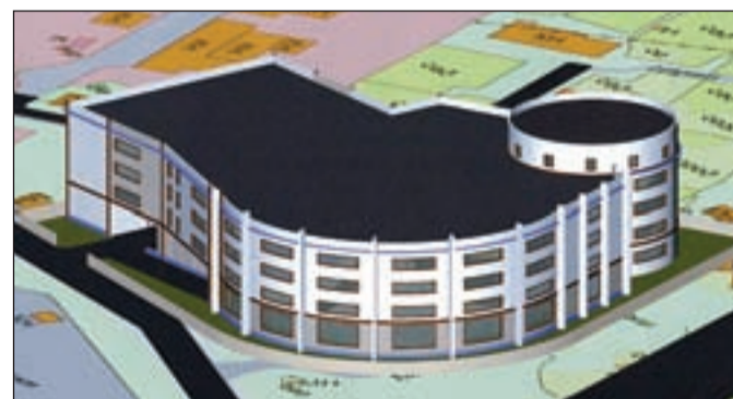
• Проект автостоянки на улице Верхне-Пролетарской.