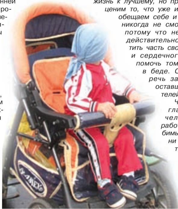
• У каждого ребёнка должна быть семья.

чувством жалости там, где нужен расчёт и трезвая оценка собственных сил — чтобы потом не остановиться на полдороги и не повернуть назад. Мы хотим изменить нашу жизнь к лучшему, но при этом часто не ценим то, что уже имеем. Мы часто обещаем себе и другим то, чего никогда не сможем выполнить, потому что немногие из нас действительно готовы потратить часть своих сил, времени и сердечного тепла, чтобы помочь тому, кто оказался в беде. Особенно, когда речь заходит о детях, оставшихся без родителей.