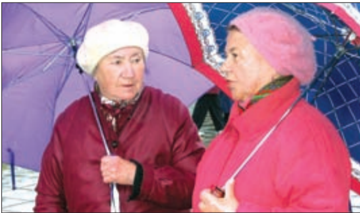
• К пенсии стоит готовиться загодя.

Таким образом, для реализации застрахованным лицом своих пенсионных прав в полном объеме необходимо, чтобы индивидуальные сведения формы «Назначение пенсии» были представлены всеми страхователями, с которыми лицо, подавшее заявление о назначении пенсии, состояло