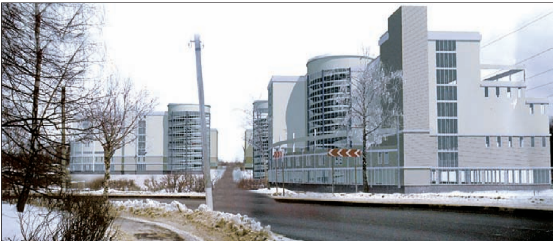
• Такой современный автостоянку может стать украшением нового микрорайона на улице Северной.