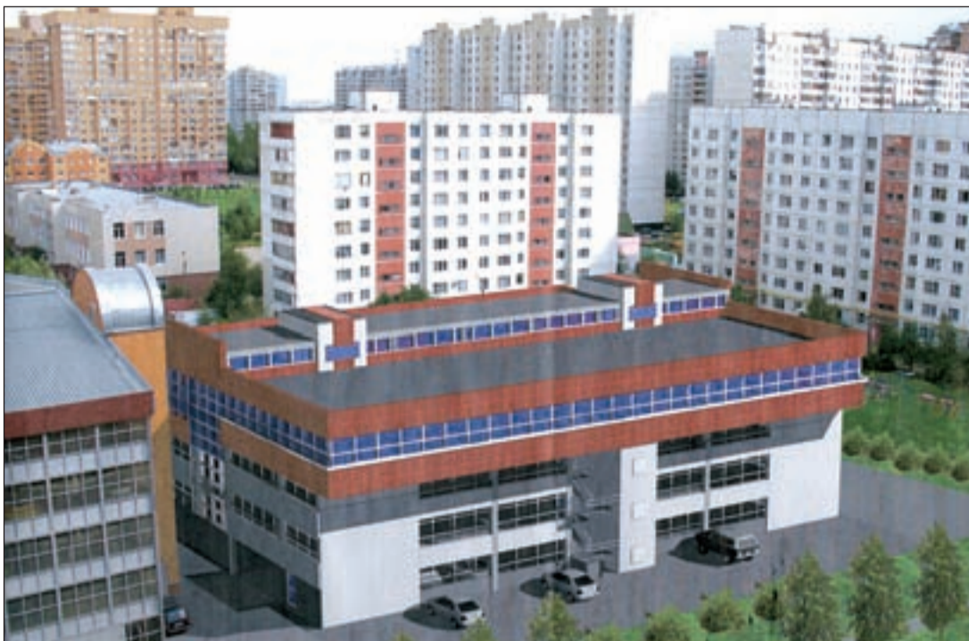
• Проект автостоянки на улице Чикина.

По-прежнему мы занимаемся эвакуацией так называемого брошенного транспорта. Для этого у нас имеются все возможности и специализированный автотранспорт, которым мы собираем со всех городских улиц старые автомобили: часть сдаем в утиль,