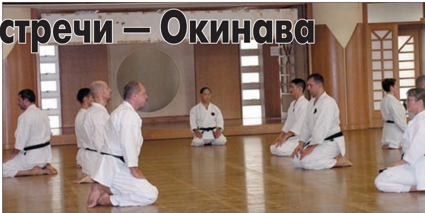
• На семинаре мастера Морио Хигаонна.

В Японии, на острове Окинава всемирно известный мастер Морио Хигаонна (10-й дан) провел международный семинар по Годзю-рю каратэ-до. Нашу страну представляли две организации: Федерация Годзю-рю каратэ-до и Организация содействия развитию Годзю-рю каратэ-до. Федерацию Годзю-рю каратэ-до возглавлял директор и тренер ДЮСШ «Горки-10» из сельского поселения Успенское Игорь Лизунков. Мы попросили его поделиться впечатлениями о поездке на Окинаву.