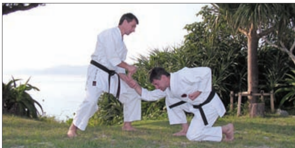
• Теорию — в практику.