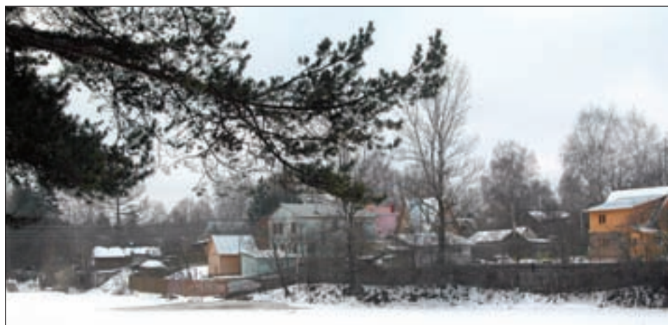
• Здесь зарождалась Трубачеевка.