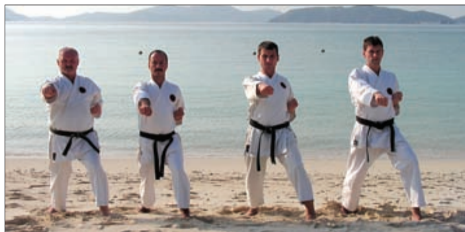
• Солнце, вода, здоровье.

Подготовил Виктор РОГОВИК.