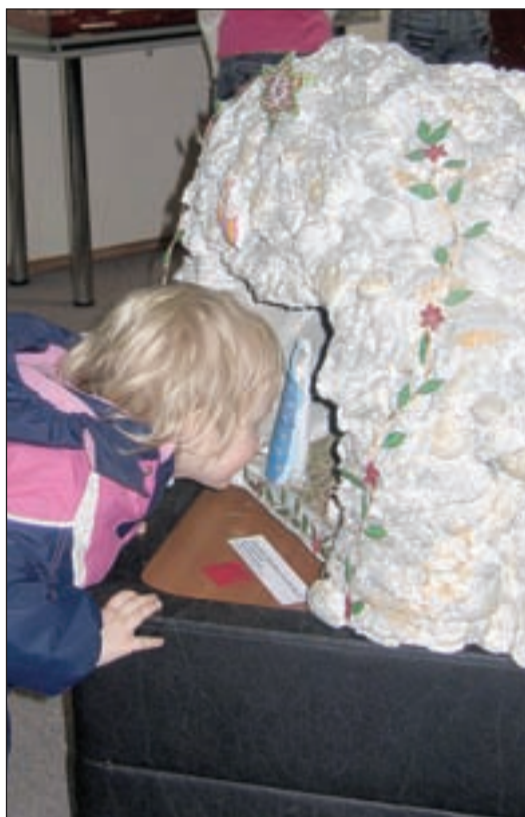
• Детские работы вызвали интерес даже у самых маленьких посетителей.