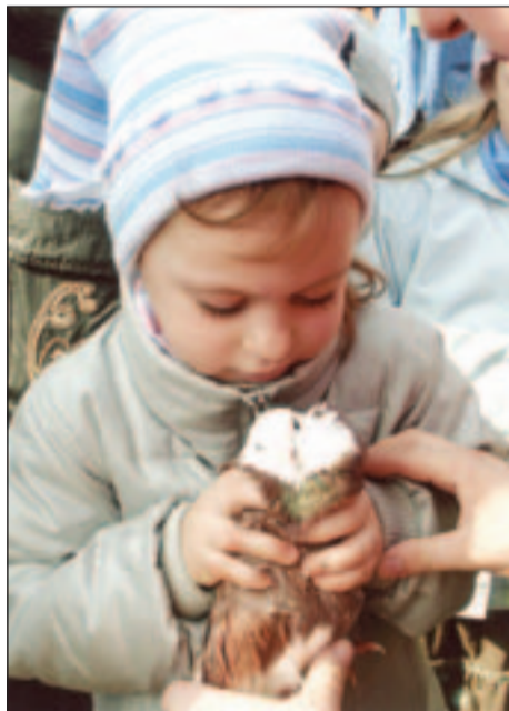
"В чужбине свято наблюдаю родной обичай старины: на волю птичку отпущаю при светлом празднике весны".

После богослужения все были приглашены на праздничную трапезу, за которой молодежный хор дал концерт.