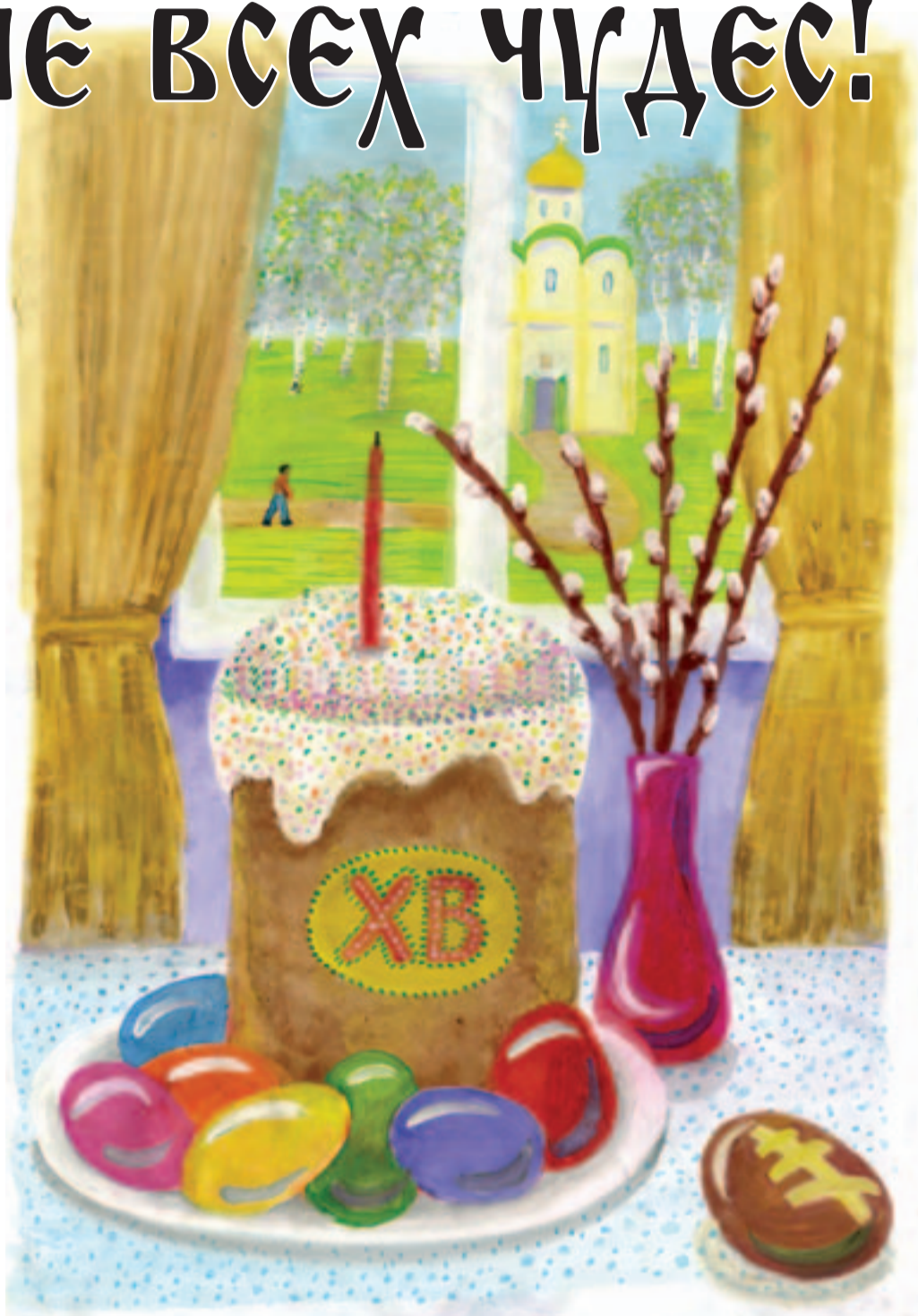
Рисунки выполнены детьми из Православного Центра при Гребневском храме.