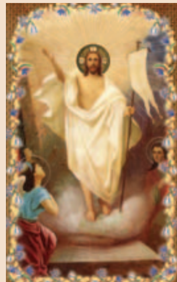
всеобъемлюща, так светла и животворна радость Воскресения: Христос Воскресе!

Но особенно светло, живым ключом бьет эта радость небесная в храмах Божиих. И праздничное убранство храма, особенно же Престола Божия, и отверстие в продолжение всей седмицы врата царския, и благоухание фимиама, и многое множество горящих свечей и разноцветных лампад, и эти ликующие, дышащие святым восторгом лица молящихся, и эти неподражаемые, возвышенно поэтические песнопения канона — все это в совокупности переносит нас в ту вечноблаженную жизнь, которая настанет в последний день мира после преводеленного призыва: приидите благословения Отца Моего, наследуйте царствие, уготованное вам от сложения мира... Даже воспоминание о грехах не смущает души: ведь Святой Златоуст и грешника успокаивает: никто же, говорит он, да плачется прегрешений: прощение бо от гроба возсия. Так глубока,