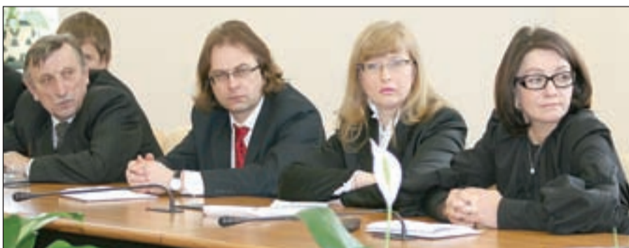
• Тема «круглого стола» затронула и наших...