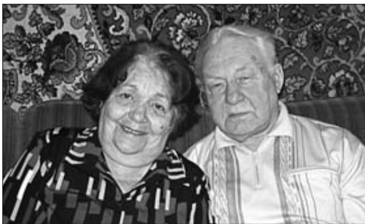
• Случайная встреча связала их на долгие-долгие годы.