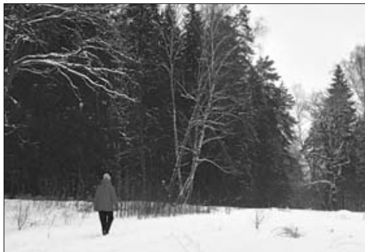
• На фото февраля 2009 года — место развилки лесной тропы. Прямо вдоль Самынки тропа ведет к деревне Подушкино. Влево она поднимается в густой лес и ведет к поселку Жуковка. Ныне по этой тропе проложен участок лыжной трассы.