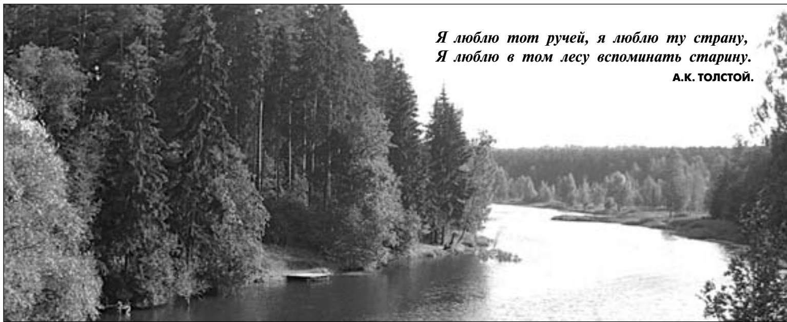
• На фото августа 2008 года — вид с Красногорского шоссе на Решетников пруд, наполненный водами зарождающейся здесь речки Самынки. В прошлом веке в летние дни на его тенистых берегах любили отдыхать и рыбачить местные жители.

Кроме Решетникова пруда ниже по течению Самынки у деревни Подушкино располагается лесной пруд. Примерно в полутора километрах за ним — большой пруд на территории санатория «Барвиха». В километре от него находится Барвихинский пруд у так называемой Теплой горки и, наконец, последний пруд — на территории дачного поселка. В середине XIX века на речке был еще один «Сомынский пруд» — последний перед ее впадением в Москву-реку. Об этом пруде оставил воспоминания замечательный русский писатель Сергей Тимофеевич Аксаков. В детском возрасте С.Т. Аксаков, как и многие живущие в деревне мальчишки, пристрастился к ры-