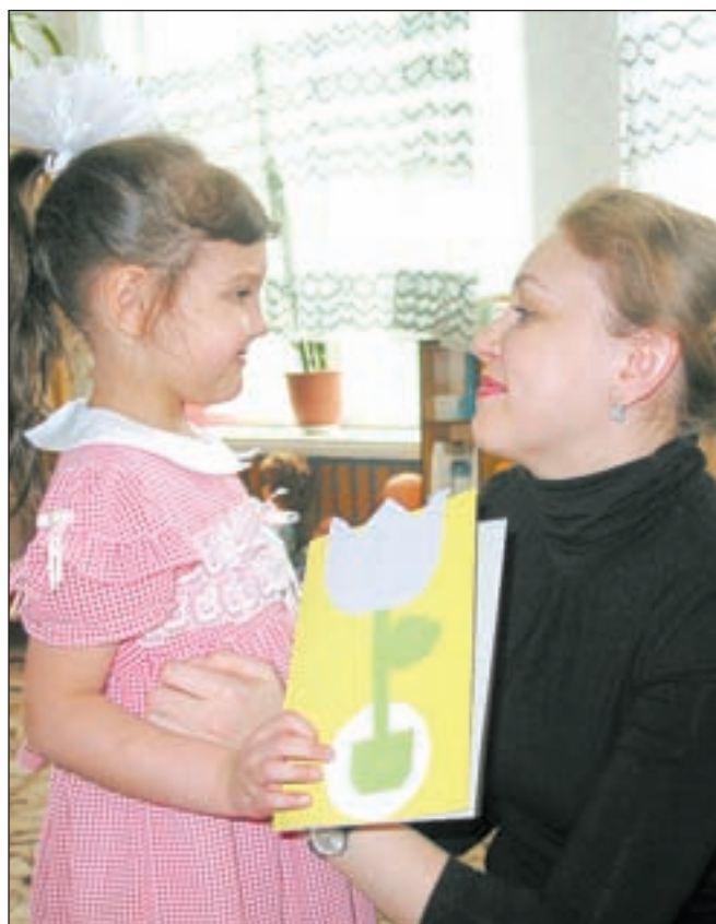
• Самые дорогие поздравления и подарки мы получаем от наших детей... Эти неуклюжие поделки, робкие рисунки мы — мамы, сохраним навсегда.