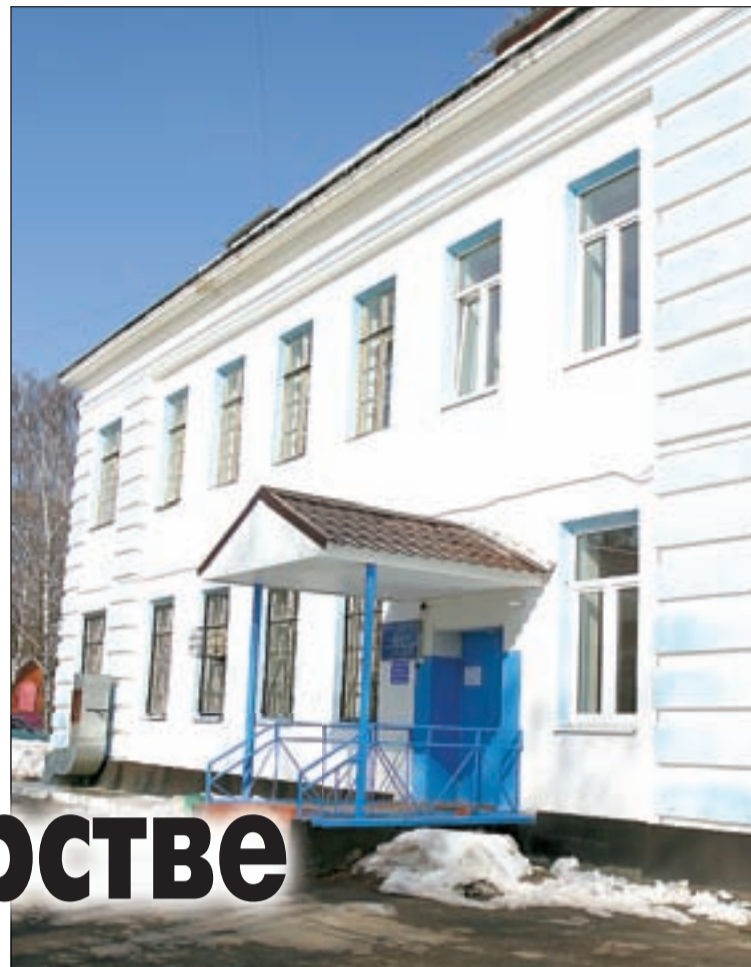
• Здание Одинцовского противотуберкулёзного диспансера.