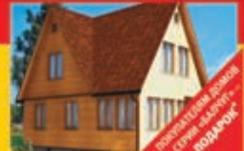
«Балчуг» 6х4,2х3,8 м (каркас) – 772 770 руб. «Балчуг» 8Сх 6,2х3,8 м (строительный брус) – 798 800 руб. «Балчуг» 8Сх 6,2х3,8 м (клееный брус) – 886 800 руб. Срок строительства: 18-25 дней

* С 01.04.2009 г. по 30.04.2009 г. покупателям домов серии «Балчуг» подарок – установка филленчатых дверей во всем доме и устройство теплоизоляционных полов 1-го этажа.