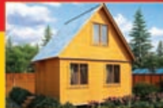
«Ярлык» 150х1,2х4,2 м (каркас) – 238 980 руб. «Ярлык» 8С 150х1,2х4,2 м (строительный брус) – 277 620 руб. «Ярлык» 8С 150х1,2х4,2 м (клееный брус) – 343 170 руб. Срок строительства: 4 дня