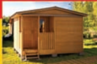
«Отрадный» 4,2х4,2 м (каркас) – 94 970 руб. Срок строительства: 1-2 дня