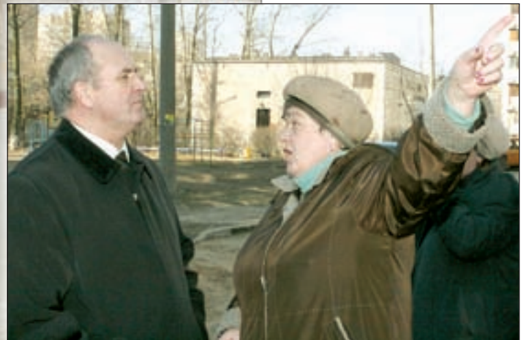
• Жителям есть что показать мэру.

этот вопрос нельзя. Ведь, как оказалось, на территории восьмого микрорайона немало ветхого фонда и домов с похожей проблемой. И соответственно — письменных заявлений на эту тему от жильцов.