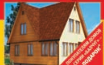
«Балчуг» - 6,2x9,0 м (каркас) - 772 770 руб. «Балчуг» БС-6,2x9,0 м (строительный брус) - 798 800 руб. «Балчуг» БС-6,2x9,0 м (зеленый брус) - 886 800 руб. Срок строительства: 18-25 дней

* С 01.04.2009 г. по 30.04.2009 г. покупателям домов серии «Балчуг» подарок – установка филленчатых дверей во всем доме и устройство теплоизоляционных полов 1-го этажа. Подробности акции на сайте и по телефону. Цены указаны на базовые комплектации домов согласно технической документации. Изображения отражают архитектуру домов и не несут информации об используемых отделочных материалах и конструктивных особенностях. Цены на строительство домов в регионах могут отличаться от цен в Москве и Московской области. Лицензия: ФС-1-99-03-26-0-7716202498-031620-1 от 24.10.2005 г., ФС-1-50-03-27-0-500701566133-031801-1 от 02.11.2007 г.