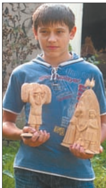
Когда ученики овладевают этим, задания усложняются, и ребята учатся изготавливать фигурки лошадок, всадников. Потом