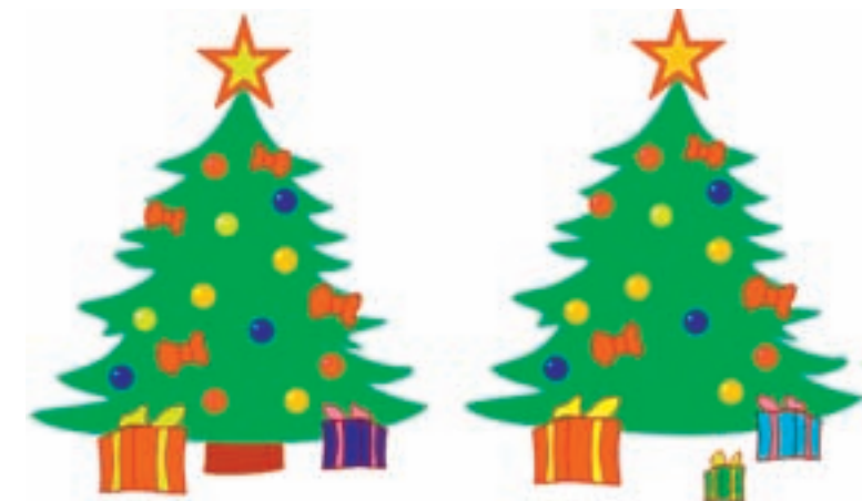
• Найди отличия.

Вы показываете какие-либо действия, одновременно называя их. Неожиданно, комментируя очередное действие, например: «Руки на пояс», опустите руки вниз, стараясь подловить малыша. А если ребенку удастся подловить вас, это ему очень понравится!