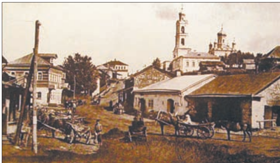
• Вид города Рузы. Открытка начала XX века.