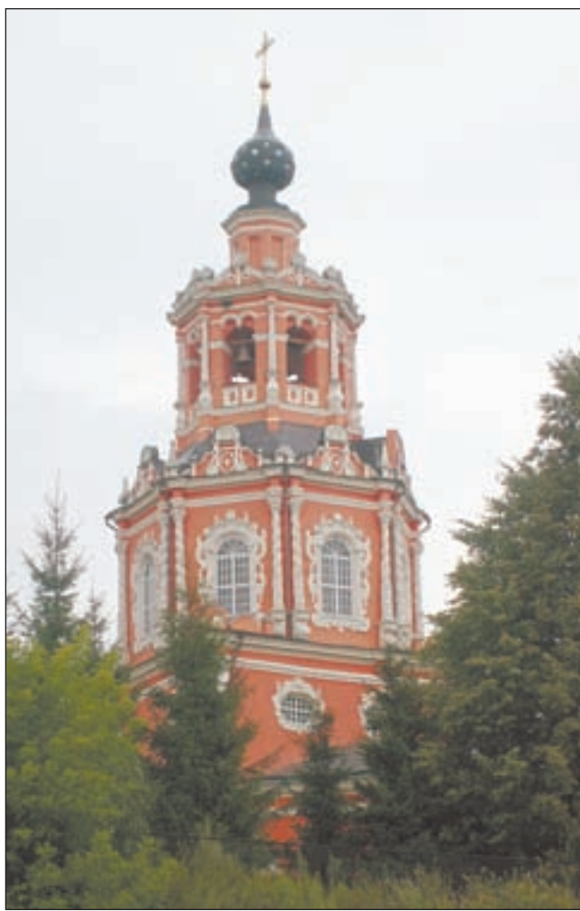
• На фото августа 2009 года — место «перевоза» через Москву-реку в километре от сельского храма (выше по течению, напротив деревни Борки). Река в этом месте имеет пологие берега, а ее ширина составляет всего около 130 метров. По свидетельству старожилов, перевоз на лодках находился здесь вплоть до середины прошлого века. публикуется впервые.

Во времена путешествия Миллера Можайск скорее походил на большую деревню, чем на город. В работе «Описание городов Московской провинции» Миллер отмечает: «Подлинно, по наружному виду Можайск — самый бедный город, дворы ни малюго преимущества пред деревенскими не имеют <...>. Каменная крепость на возвышенном месте при реке Можайке — такая, как в древние времена строить обычай был, не содержит ничего, oprичь церкви и воеводской канцелярии. У большей части