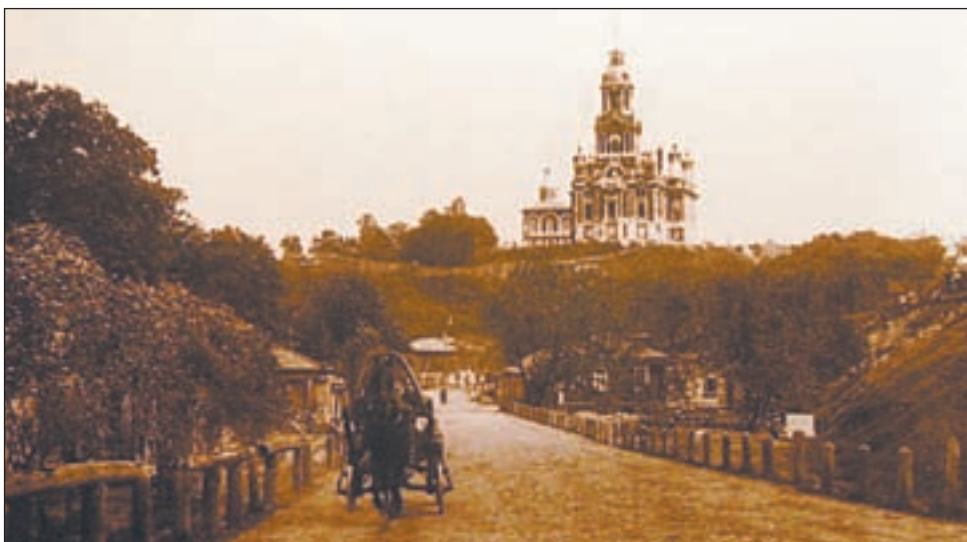
• Старая Смоленская дорога в городе Можайске. Вдали виден Никольский собор, возведен в 1812 году. Открытка начала XX века.