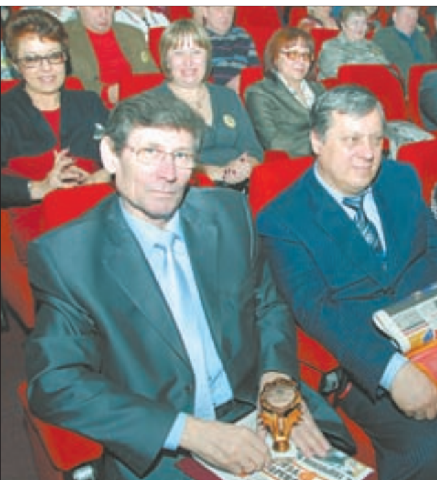
• В зале собрались лучшие представители трудовых коллективов Одинцовского района.