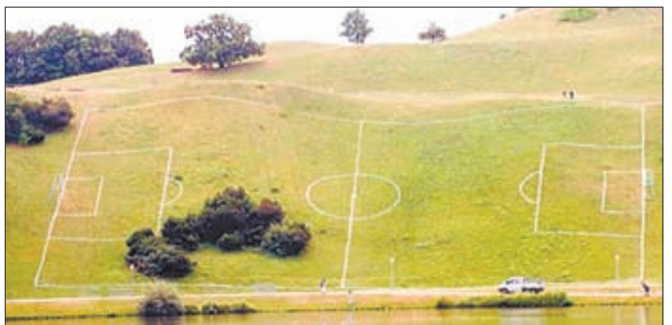
• Поле, русское поле...