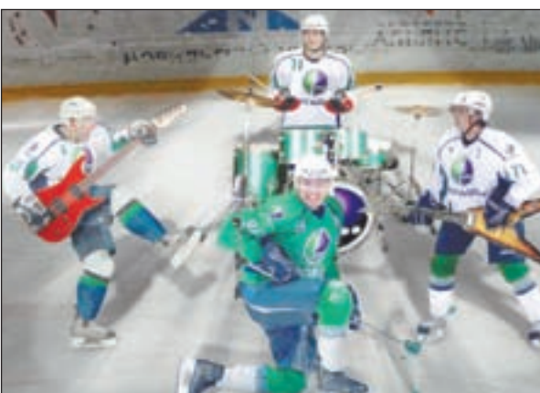
◀ Великолепная четвёрка!