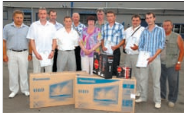
• На финише конкурса — водители Одинцовского ПАТП.