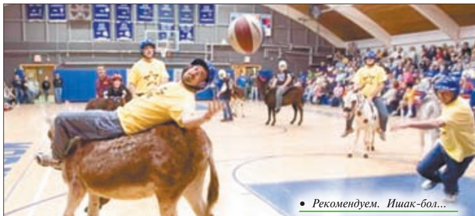
• Рекомендуем. Ишак-бол...