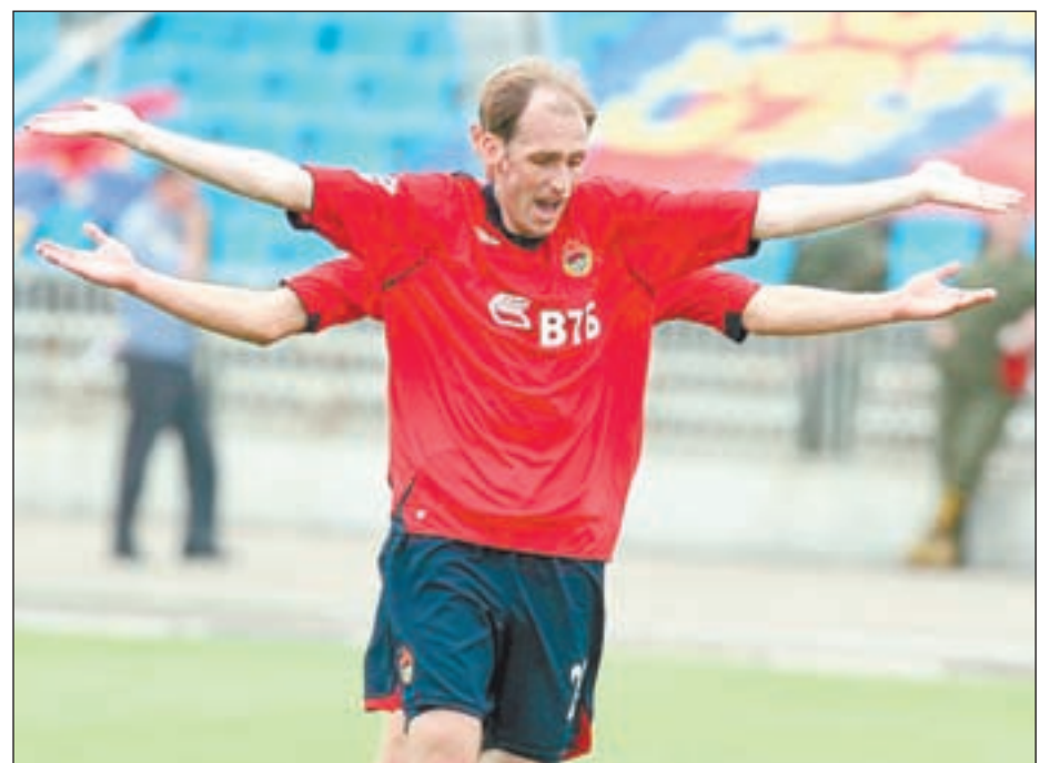
• Шива, конечно, многорук, но футболиста «кормят» ноги....