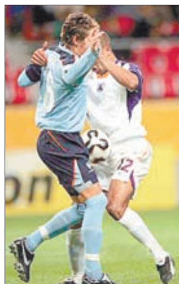
• Танцуем, а мы с тобой танцуем...