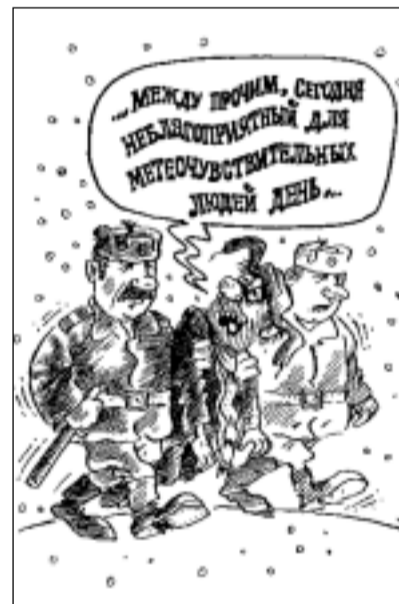
Рис. В. КРЕМЛЁВА.

Ночью температура воздуха минус 9-12 градусов, днем минус 8-10. Вероятен снегопад. Ветер северо-восточный, пять-шесть метров в секунду. Атмосферное давление 723 мм рт. ст.