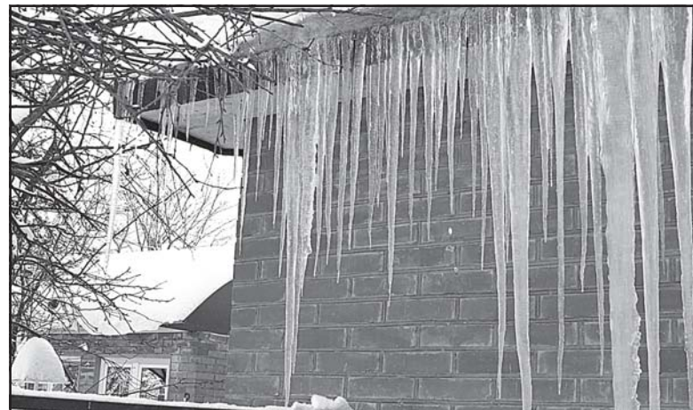
• «Ты сюда не ходи. А то снег башка попадет...»