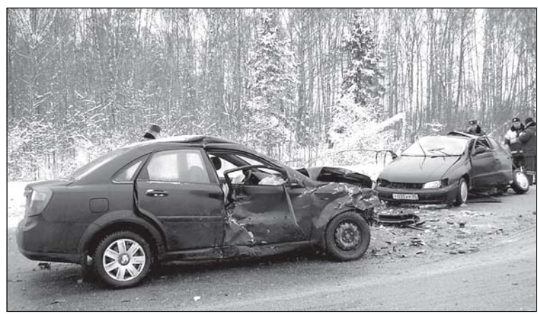
• Дорога не выбирает: здесь бьются и легковушки, и грузовики, гибнут и взрослые, и дети...

Информация предоставлена ОГПН Одинцовского района и инспектором по пропаганде БДД 10-го спецбатальона ГИБДД Подмосковья Юрием Полянским. Подготовила Настя ЧИЧКОВА.