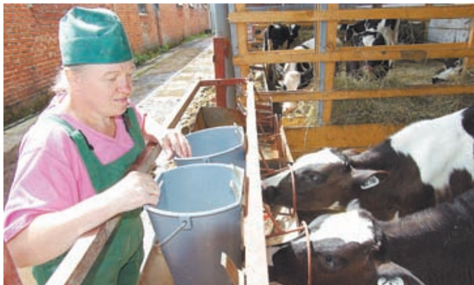
В «Кленово-Чегодаево» активно переходят на новые технологии содержания животных.