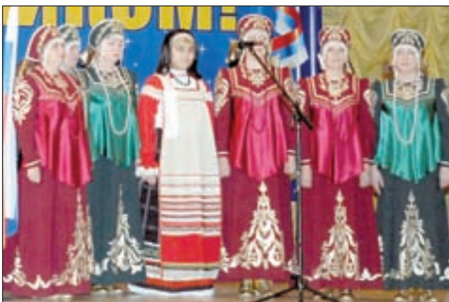
• Торжественное открытие Народного собрания в Часцах.

ления выделит денежные средства, чтобы стареющее и требующее ремонта здание превратить в красивое и современное детское учреждение.