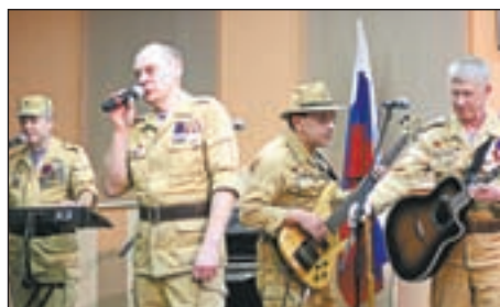
• Стихи и музыкальные композиции группы «Контингент» никого не оставили в этот день равнодушными.