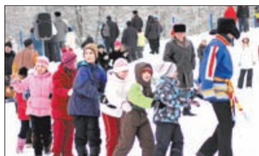
• Скоморохи, ряженые и ростовые куклы веселили детвору и взрослых на площади перед Культурным центром «Барвиха».