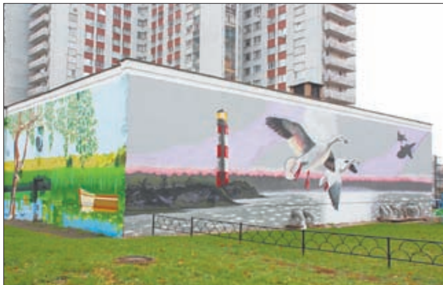
• На некогда серые здания теперь приятно смотреть.